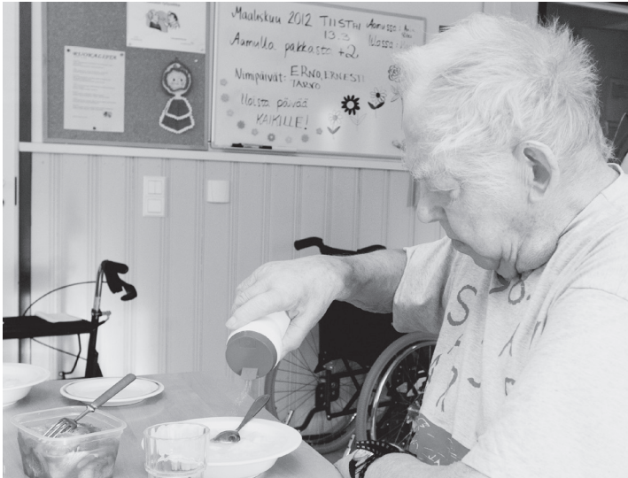
Kuva 2. Mahdollisuus suolaisen syötiin: tutkijalle merkityksellistä, kuvatulle kenties itsestäänselvyys.

sakin näkyi. Ilman kuvaa olisi ollut vaikeaa tai ainakin työlästä todentaa sama tunnelma sanallisesti. Valokuvaelisitaatio, siihen sisältyvä valokuvahaastattelu ja reflektio antanevat todellisuudesta enemmän kuin pysäytetyn visuaalisen todisteen. Näiden menetelmien soveltaminen yhdessä kertoo kuvattujen läsnäolosta, heidän elämästään. Näin voi sanoa, että menetelmän avulla syntyy ”sosiaalisia kommentteja” (Berger 1987, 131).