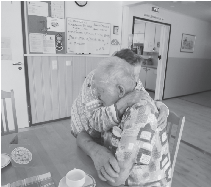
Kuva 3. Nimipäivähalaus.

luonteesta. Kuvat sisältävät merkkejä yhteisön avoimesta toimintakulttuurista, hyvästä ilmapiiristä ja yhteyden kokemuksesta, ja nämä seikat avautuvat ja todentuvat täydellisemmin saadessaan tuekseen sanallista tulkintaa. Hine (1984, alkuperäinen teksti 1909) toteaa, että sosiaalityön tunnuslauseena pitäisikin olla ”tulkoon valkeus” ja että tässä taistelussa valolla kirjoittaminen eli valokuvaus voi olla apuna. (Emt. 61.)