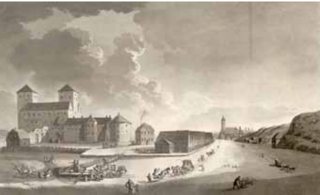
Turun linna 1790-luvulla. Taustalla näkyy myös Turun tuomiokirkko. Kuva on A. F. Sköldebrandin matkakertomuksesta Voyage pittoresque au Cap Nord . Stockholm: C. Deleen & J.G. Forsgren, 1801.

keräämässä saataviaan Lammilla, mistä hän oli matkannut (Hämeen)Koskelle saarnaamaan. Kihl oli todistettavasti palannut matkalta 22.1. Seuraavana päivänä hän oli saattanut kälyään ja nukkunut Hanabölen kylässä vanhan nimismiehen pojan eikä Annan luona. 32