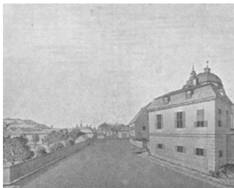
Turun akatemiatoria vuodelta 1795. Oikealla on anatomian tutkimuslaitos, jonka taakse silloinen päärakennus ja tuomiokirkko jäivät. Vasemmalle rakennettiin sittemmin nykyisin vanhana Akatemia-talona tunnettu rakennus.