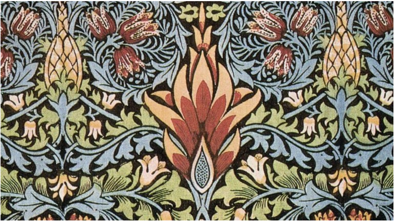
Snakeshead-painokangas vuodelta 1876.

Kävin pukuhuoneessa jaakobinpainia. En tarvitse yhtään uutta tunikaa. En halua tukea H&M:ää. Todennäköisesti laatu on surkea, tunika kutistuu pesussa, enkä voi käyttää sitä enää. Silti halusin tunikan. En ehkä kehtaisi pitää sitä julkisesti ( "Tuo sääliittävä nainen on naurettavan, halvan, Morris-kaupallisuuden uhri!" ), mutta voisin pitää sitä kaapissa, ottaa välillä esille ja ihaila sen kauneutta. Lisäksi sen avulla voisin esitellä lapsilleni Morrisin nerokkuutta.