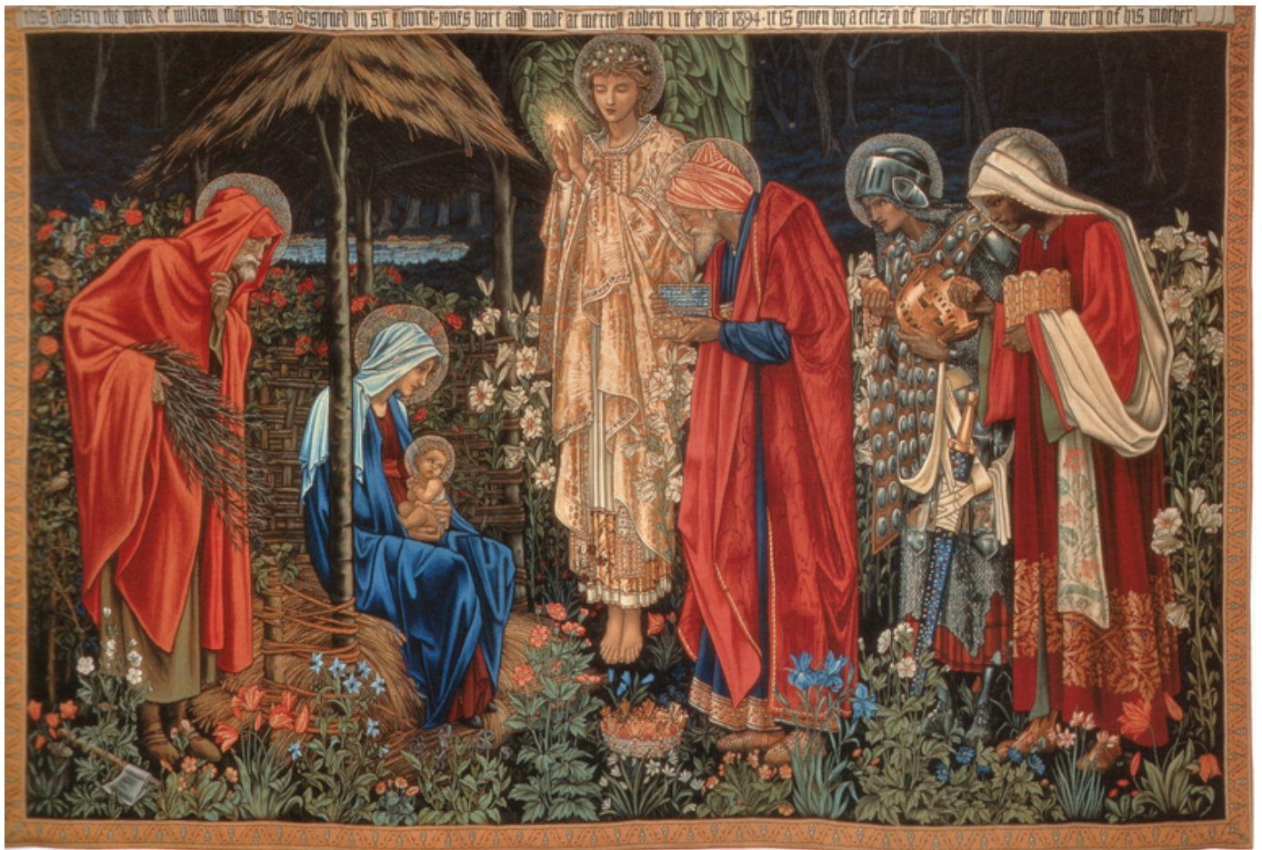
The Adoration of the Magi (kopio).

Silti syksyn uutinen Morris & Co:n yhteistyöstä ruotsalaisen H&M -vaatetehtaan kanssa löi ällikällä. Pimpernel ja muut klassikkokuosit olivat nyt saatavilla puseroina, mekkoina ja housuina lähimmästä henkkamaukasta. Kuosit näyttivät kuvissa yhtä ihastuttavilta kuin ennenkin: kukkia, lintuja ja kasviköynnöksiä, upeita, hienostuneita väriyhdistelmiä ja runsas muotokieli. Paita 9,99€, mekko 29,99€. Morrisit olivat nyt todellakin kaikkien ulottuvilla.