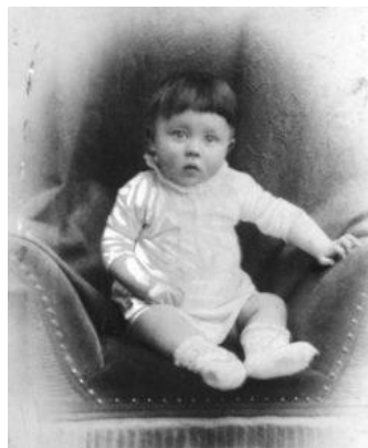
Adolf Hitler lapsuudenkuvassa