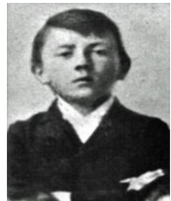
Adolf Hitler koulukuvassa