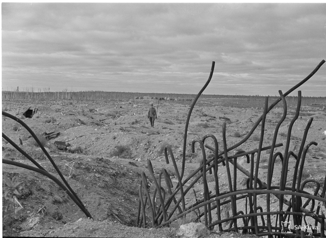
Kuva 2: Sodan vastamaisema Summassa. Summa, Lähteen lohkolta 26.9.1941.

Rintamalla sotilaat joutuivat yleensä viettämään paljon aikaa ulkona eri tehtäviä hoitaessaan. He elivät mitä suurimmassa määrin luonnon ehdoilla ja sään armoilla, ja siitä syystä ympäröivä maasto ja varsinkin vaihtelut säässä vaikuttivat merkittävästi sotilaiden kokemuksiin elämästä rintamamaisemassa. Kesällä hyttyset kiusasivat, talvella kärsittiin kylmyydestä, ja