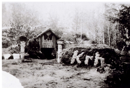
Kuva 3: Sotamies Göran Sax korsunsa edessä. Maastoon piilotetun asuntokorsun tuli tarjota sotilaille suojaa tulelta ja siksi ne naamioitiin, vahvistettiin ja kaivettiin syvälle maahan. Asemasodan aikana maisemaa myös kaunistettiin. Kuva otettu kesällä 1942 jalkaväkirykmentti 61:n alueelta Syvärillä.

sellaiseen, mikä vaikuttaa tutulta. Kun mitään tuttua ei ole, sinne luodaan sellaista, mikä tuntuu tutulta. Kotiseudusta ja kaikesta, mikä tuntui omalta, läheiseltä ja tutulta ei näin ollen luovuttu rintaman vieraassa ympäristössä. Päinvastoin, monta arkista, normaalia, rauhanaikaista toimintaa siirrettiin rintaman arkeen (vrt. Jürgenson 2015, 118). Sotilaat kantoivat mukanaan kotiyhteisössään omaksumaansa kulttuuria ja perinteitä, sen arvoja, normeja, tapoja ja tottumuksia (Petrisalo 2004, 72). Rintamalla näistä pidettiin kiinni: siisteyttä ja järjestystä pyrittiin ylläpitämään (luutnantti Ulf Segerstråle äidilleen 3.6.1942; ylikersantti Curt Enroth vaimolleen 9.6.1942) ja joulua ja muita vuotuisjuhlia vietettiin mahdollisuuksien mukaan perinteitä kunnioittaen. Kotiväki osallistui monin tavoin rintamamiesten pyrkimykseen luoda jatkuvuuden tunnetta. Paitsi siemeniä, kotoa lähetettiin myös astioita, sisustustekstiilejä, joulukoristeita ja paljon muuta, joilla arkielämää rintamalla normalisoitiin. (Aiheesta enemmän Hagelstam 2014.) Paikka otettiin näin ollen haltuun monien arkisten käytänteiden avulla.