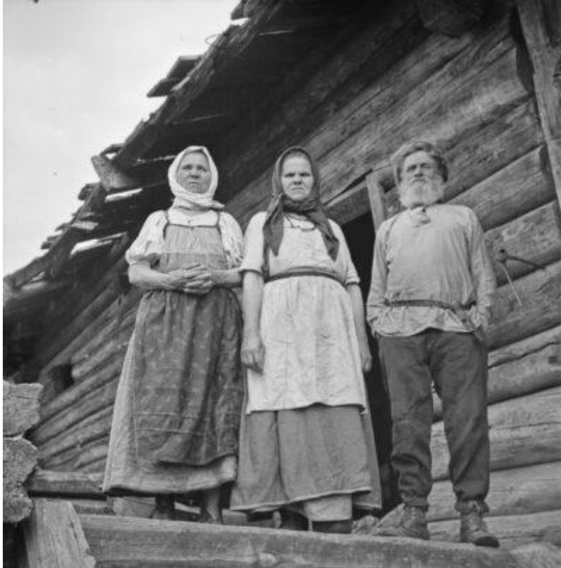
Koskezenkylä, Paatene, Itä-Karjala. Kuva: Väinö Kaukonen 1943. Museovirasto, Suomalais-ugrilainen kuvakokoelma.

Pohjoismaissa viimeistään 1990-luvulta tehty poliittiseen ja yhteisölliseen vuorovaikutukseen sekä oikeuslaitoksen toimintaan liittyvä tutkimus kertoo tasapainoisemmin ajan todellisuudesta. Tästä vähäisestä kritiikistä huolimatta kokonaisnäkemys tutkimuskohteiden elämän realiteeteista on pääosin hyvin perusteltu ja esimerkiksi poikkeuksellisen ankarista 1630-, 1690- ja 1710-luvun ajoista tehdään moniulotteinen ja eri alueiden erilaisia kohtaloitakin painottava analyysi.