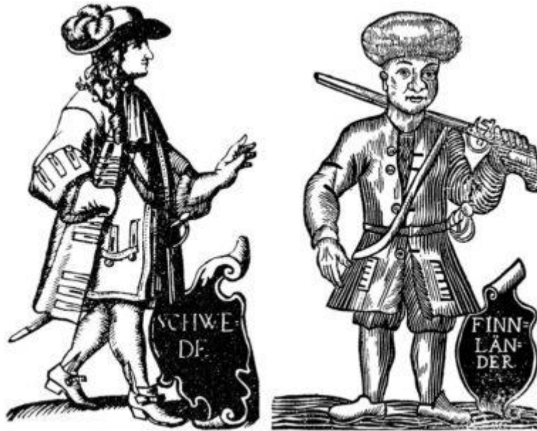
Ruotsalainen aatelismies ja suomalainen alempisäätyinen esiintyvät piirroksina Neueröffnetes Amphi-Theatrum -kirjassa vuodelta 1723.

Kirjassa sijansa saavat myös niin papit kuin porvaritkin, joten kirjoittaja onneksi loiventaa määritelmää toteamalla, että osa tutkimuskohteista on ”ikään kuin rahvaan ja yläsäätyjen välimaastossa”. Silti käsitys rahvaaseen kuuluneista henkilöistä muuttui pitkän tarkastelujakson aikana, kun Ruotsin ja Suomen yhteisen ajan lopulla varakkaimmat talonpojat saatettiin laskea säätyläisiin eli varsinaisen rahvaan vastapooliin. Kuitenkin juuri tämän tyyppinen käsitteellinen väljyys osoittautuu teoksen vahvuudeksi, sillä sen myötä tekijä pystyy ottamaan luontevasti kantaa koko yhteisöä ja ruotsalais-suomalaista yhteiskuntaa koskeviin isoihinkin asioihin.