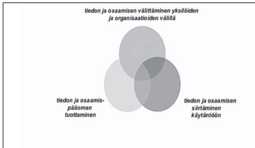
KUVIO 2 Avainprosessit (Husso 2004, 45; Ritsilä & Haukka 2003, 11 pohjalta)

Tiedon ja osaamis-pääoman tuottaminen tapahtuu paljolti kehittämishankkeen aikana, ja tämä osuus on toteutunut Väistö-hankkeessa hyvin, kuten raportissa on eri yhteyksissä useaan otteeseen todettu. Hankkeessa kehitettyjen toimintamallien jatkuvuuden näkökulmasta tiedon ja osaamis-pääoman tuottamisen onnistuminen on erittäin tärkeää. Se on edellytys projektin onnistumiselle, mutta jatkuvuuden näkökulmasta yksinään riittämätöntä. Hankkeessa tuotetun osaamisen ja uusien toimintamallien hyödyntämisen näkökulmasta hankkeen päättymisen jälkeen kriittisiä osa-alueita ovat tiedon kulku eli tiedon ja osaamisen välittäminen yksilöiden ja organisaatioiden välillä sekä tiedon ja osaamisen siirtäminen käytäntöön . Hankkeen toimenpide- ja kehittämissuosituksot esitellään siten näiden alaotsikoiden alla.