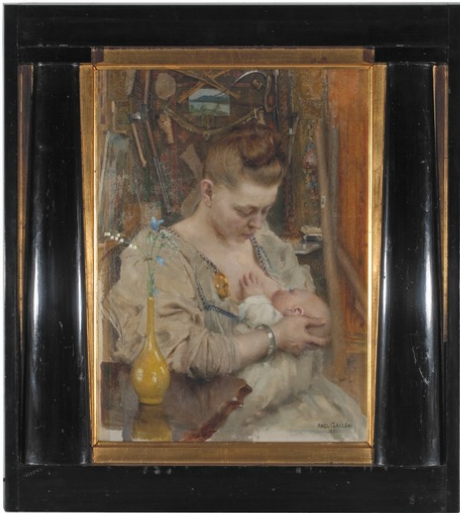
Axel Gallén, Madonna, öljy kankaalle (1891).