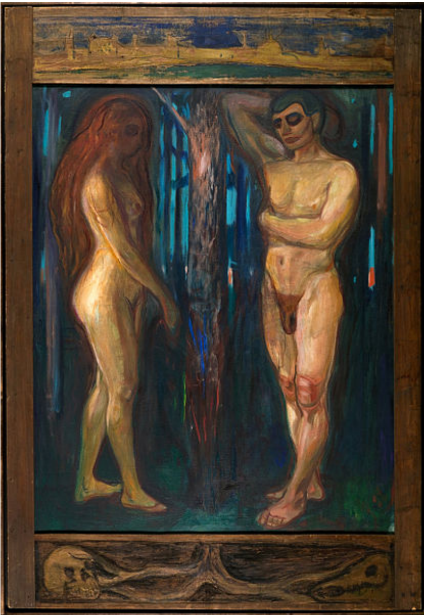
Edvard Munch: Metabolismi, öljy kankaalle (1898-1899).

Munchin Madonna -litografian tapaan myös hänen Metabolismi -niminen öljymaalauksensa on alkuperäisessä muodossaan sisältänyt sikiöhahmon, jonka taiteilija on myöhemmin, teosta muokatessaan kätkenyt puunrungon alle. Muutos käy ilmi valokuvista, jotka otettu, kun teosta esitelty ensimmäisissä näyttelyissä. [36] Metabolismi -teos on liitetty kristallisaatioteemaan, jolla on kosketuskohtia esimerkiksi Haeckelin monismiin. [37] Puukehysten ympäröimässä Metabolismi -teoksessa on kuvattu eräänlaista kosmista aineenvaihduntaa. Teoksen keskiöön on sijoitettu alaston nainen ja mies, jotka seisovat paratiisillisesta alkutilasta muistuttavan puunrungon molemmin puolin. Maalauksella on yhteyksiä syntiinlankeemuksen ja paratiisista karkottamisen perinteisiin kuvaustapoihin, mutta kuvaa ympäröivä näyttävä puukehys asettaa perinteisen raamatullisen kertomuksen kuitenkin kirjaimellisesti uuteen viitekehykseen. Kehyksen alareunan pääkallot viittaavat evoluutioon ja aineenvaihduntaan – eläimen ja ihmisen raadot tuottavat energiaa ihmisiä ravitsevalle puulle. Kuvan yläreunaa puolestaan hallitsee abstraktio, kaupungin siluetti, jonka voi tulkita viittaukseksi kuolemanjälkeiseen elämään, kristallien maahan. Erityisesti Haeckelin kirjoituksista kumpuavat monistiset, kuolemattomuuteen liittyvät ajatukset todennäköisesti