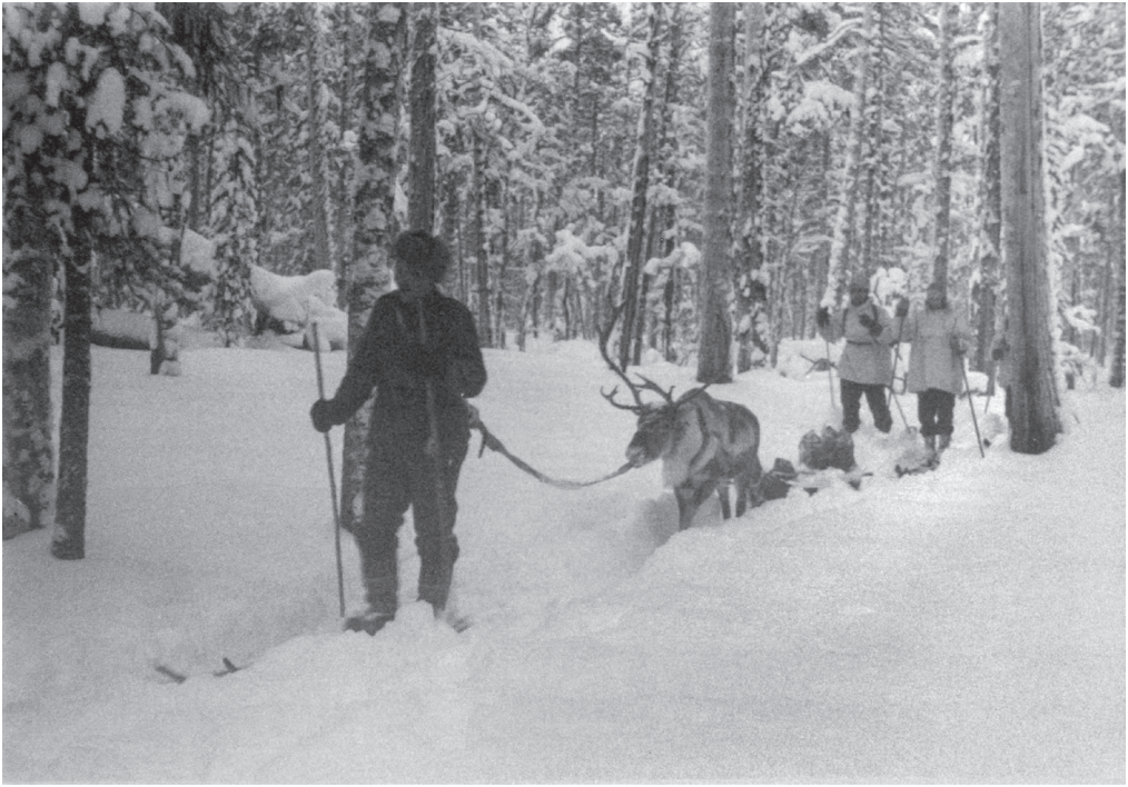
Suomalainen poronhoitaja ja sotilaita lumipuvuissaan helmikuussa 1942.

(PM 1941/3:47–48). Poromiesten kykyä suunnistaa ilman karttaa ja kompassia tarvittiin partio- tehtävissä ja monissa muissa liikkuvissa taistelutehtävissä. Myös heidän aloitteellisuuttaan arvostettiin. Suoranaisen taisteluun osallistumisen lisäksi poromiesten oli kyettävä pelastamaan rajan läheisyydessä laiduntaneet porokarjat