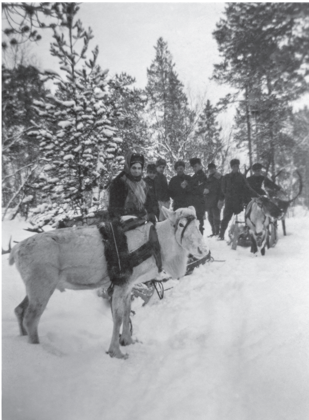
Kolttsaamelainen poroineen ja sotilasjoukko, joista ainakin yksi on saksalainen sotilas jatkosodan aikaan (1941–1944).