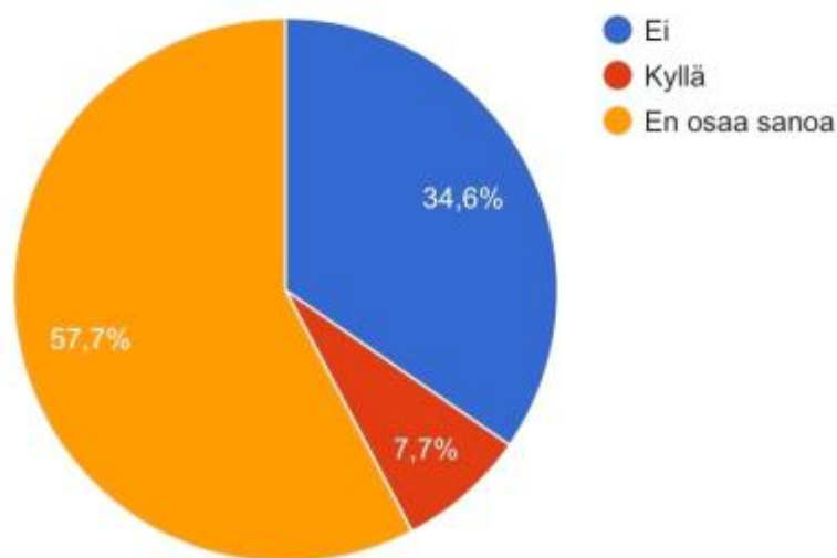
Kuvio 3. Väite koulun musiikinopetuksen positiivisesta vaikutuksesta musiikin harrastamiselle % (N=26)

Kyselyn vastanneista 35 % oli musiikkia harrastavia ja heidän mielestään koulun musiikinopetuksen tukeva vaikutus musiikin harrastamiseen vaihteli suuresti. (Ks. taulukko 3.) Heistä suurin osa eli 67% ei osannut sanoa tarkkaa mielipidettään. 22% musiikin harrastajista oli sitä mieltä, että koulun musiikinopetus ei tue musiikin harrastamista ja loput 11% olivat sitä mieltä, että koulun musiikinopetuksella on positiivinen vaikutus musiikin harrastamiseen. Mielenkiintoista oli saada selville myös tyttöjen ja poikien suhtautuminen musiikinopetuksen positiiviseen vaikutukseen musiikin harrastamista ajatellen. Selkeimmin tuloksista erottui se, että pojat olivat selvästi tyttöjä enemmän sitä mieltä, että musiikinopetus ei tue musiikin harrastamista. Tyttöille yleisempää oli epävarmuus väittämän suhteen. Tyttöjen ja poikien välistä suhtautumista musiikinopetuksen positiiviseen vaikutukseen musiikin harrastamiseen liittyen oli melko vaikea verrata, sillä vain yksi tyttö piti väittämää todenmukaisena.