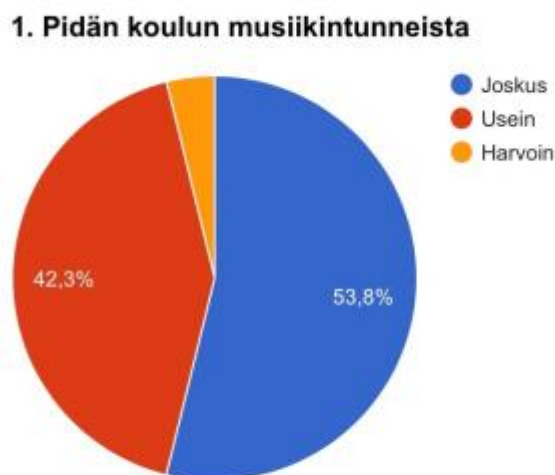
Kuvio 1. Oppilaiden mieltymys yleisesti koulun musiikintunneista % (N=26).

Ensimmäisessä kysymyksessä halusin selvittää oppilaiden ajatuksia koulun musiikinopetuksesta ja sen miellekkyydestä. 26:sta vastanneesta oppilaasta hieman yli puolet eli 54% oli sitä mieltä, että he joskus pitävät musiikintunneista. Hieman alle puolet eli 42% oli sitä mieltä, että musiikintunnit ovat usein mukavia. Vain yksi vastaajista kertoi pitävänsä koulun musiikintunneista harvoin. Yleisesti ottaen oppilaiden mieltymykset koulun musiikintunteja kohtaan voidaan nähdä positiivisinena asiana. Havainnollistan ensimmäisen kysymyksen tulokset kuviossa 1.