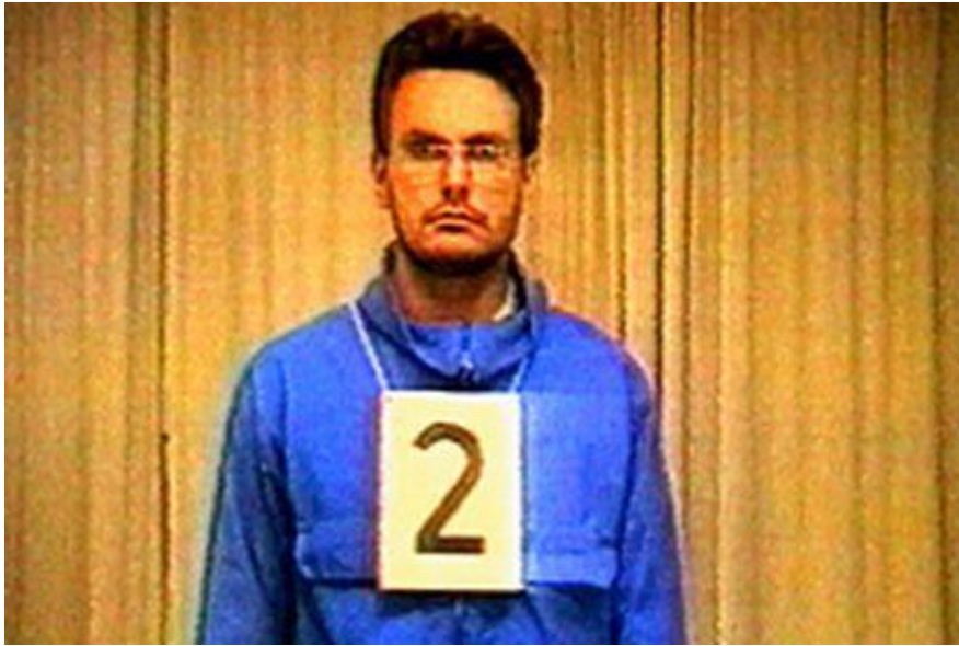
Kuva: John Ausonius tuomittiin elinkautiseen murhasta, kymmenestä murhayrityksestä ja pankkiryöstöistä.