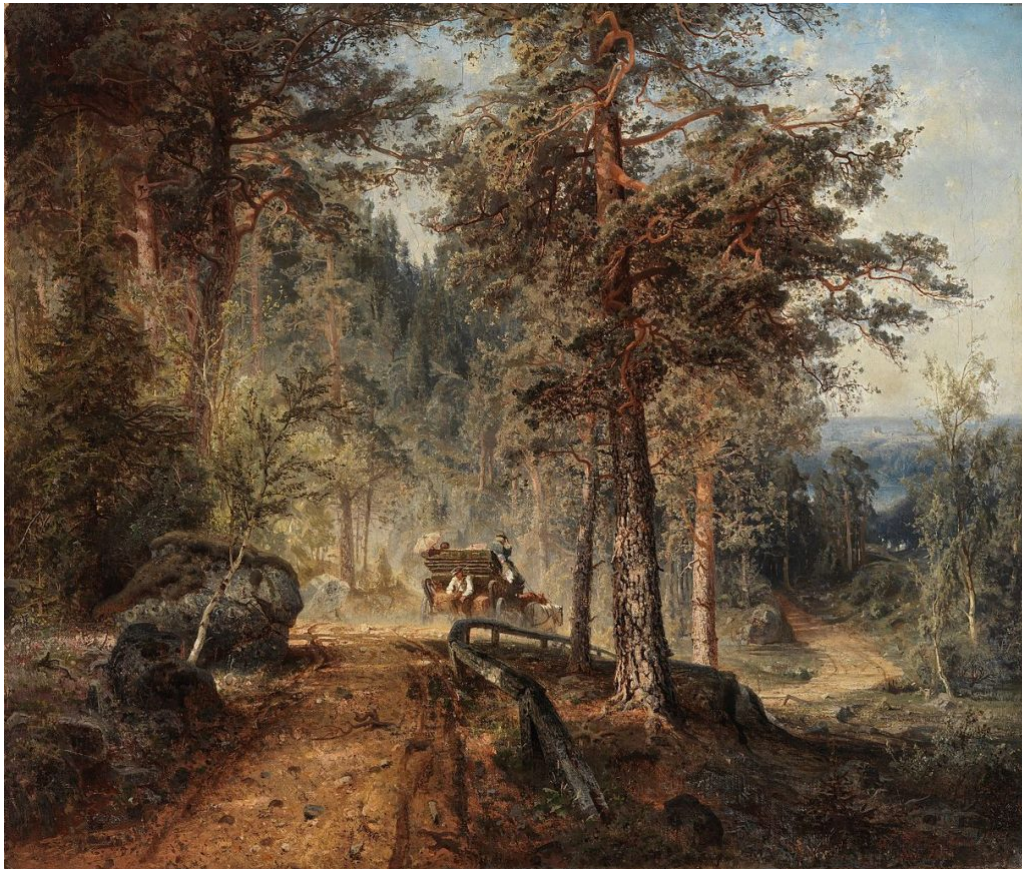
Werner Holmbergin öljymaalaukseen Maantie Hämeessä (Helteinen kesäpäivä) vuodelta 1860.

Työ, kauppa ja velka liikkuttivat ihmisiä kaikista kulkemisen kustannuksista ja uhista huolimatta. [77] Ihmisiä työnsivät ja vetivät matkaan erilaiset tekijät, eikä jälkikäteen voida varmasti sanoa, miksi kukin on matkaansa taittanut. Yleisesti on kuitenkin mahdollista osoittaa tiettyjä tekijöitä, jotka vaikuttivat lähtöpäätöksiin ja vetivät matkaan, ja tähän teemaan perehdymme seuraavassa luvussa.