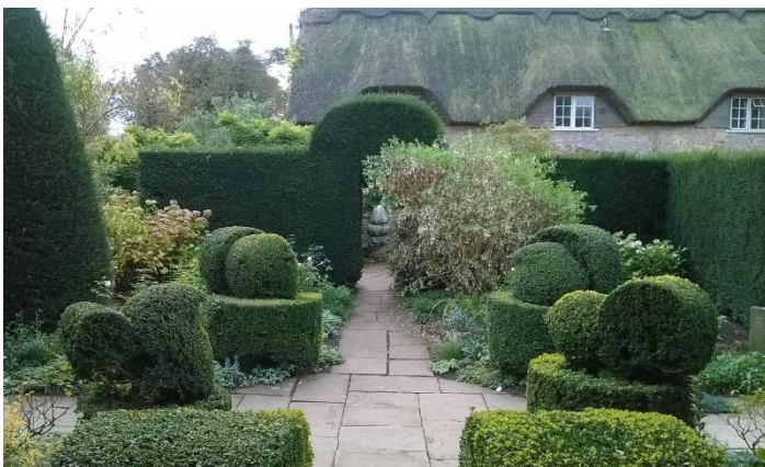
Puutarhaan luovat harmoniaa esim. elementtien toisto ja symmetria, sekä lähiväriskaala kuten Hidcote manorin White Gardenissa.

Pythagoras näki harmoniaa luonnossa ja totesi kaikkeuden muodostuneen harmonian mukaisesti. 188 Harmonia on sopusointua, tasapainoista tilaa ja yhteensopiavuutta. Puutarhan yhteydessä harmonia voi olla eri elementtien kuten istutusten massojen ja tyhjän tilan tai värien ja muotojen tasapainoa. Puutarhan harmonia syntyy kasvillisuusvalintojen, mittakaavan, kontrastien, painotusten ja järjestyksen visuaalisesti toimivasta suhteesta. 189 Versaillesin puistossa harmonia syntyy symmetriasta ja Hidcote manorin tai Sissinghurstin valkoisissa puutarhoissa myös rajoitetusta lähiväriskaalasta. Puutarhassa liikkuminen tai työskentely koetaan usein rauhoittavana ja tyyntyttävänä 190 , joten puutarhan harmonialla on syytä uskoa olevan sen kokijan ja luonnon välistä harmoniaa edistävää vaikutusta.