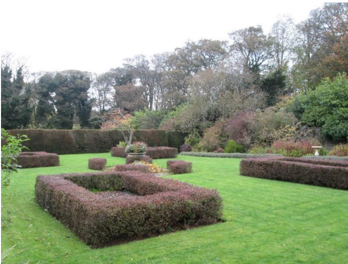
Malleny Garden Skotlannissa on kiinnostava vierailukohde myös kesäsesongin ulkopuolella. Puutarhan estetiikka on syksyllä pelistettyä. Vierailija voi tutustua puutarhaan omassa rauhassa ja pääsymaksukin maksetaan omatoimisesti sisäänkäynnin luona olevaan lukittuun postilaatikkoon.

Lumi ja talviaktiviteetit voivat olla puutarhojen vetovoimatekijöitä samoin kuin luontomatkailussakin. The National Trustin kohteet järjestävät talvikaudella tapahtumia kaikkialla Britanniassa.