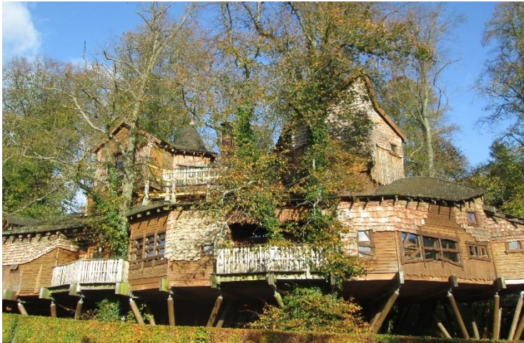
Alnwickin puutarhan puumaja toimii etenkin perhejuhlien näyttämönä. Se houkuttaa vierailulle erityisesti lapsiperheitä.

Puutarhamatkailijat matkustavat myös taimitarhoille, etenkin kun ne ylläpitävät taimivalikoimaa esitteleviä näytetarhoja. Suomessa tällaisia kohteita ovat esimerkiksi Pionien koti Taivassalossa, Taimimoisio Porissa ja Tommolan tila Leivonmäellä. Tekeminen rajoittuu taimitarhoillakin pääasiassa ostamiseen, mutta mallitutukset ja hankitut taimet innostavat omassa puutarhassa työskentelyyn.