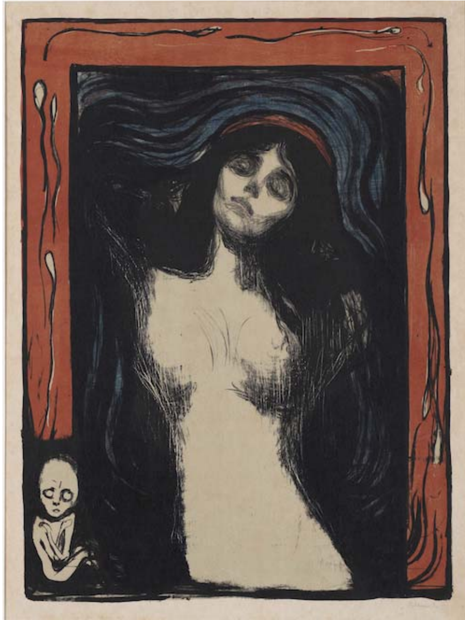
Kuva 1. Edvard Munch, Madonna, litografia (1895-1902).