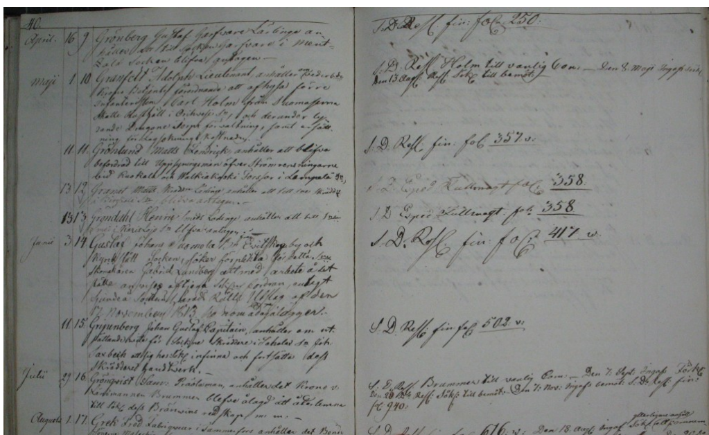
Aukeama Uudenmaan ja Hämeen lääninkansian anomusdiaarista vuodelta 1818.