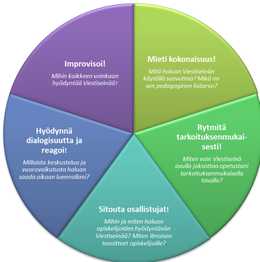
Kuvio 2. Malli Viestiseinä-sovelluksen käytöstä opiskelijoiden aktivoimiseksi

eroa on modeemilla ja reitittimellä? tai Johtaako Slow Start/Congestion Avoidance aina nopeuden heilahteluun, kun Slow Start aloitetaan aina alusta? Näissä viesteissä jaettiin myös omia kokemuksia opiskeltavasta aiheesta sekä kurssin harjoitustehtävistä. Toisten ideoita kommentoitiin ja niitä kehiteltiin yhdessä eteenpäin. Viestien avulla pystyttiin kysymään termien määrittelyjä sekä saamaan ohjeita tiettyihin tehtäviin.