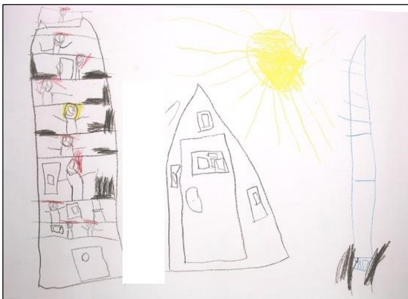
KUVA 8. Lapsen piirustus kerrostalosta, jossa isovanhemmat asuvat

Mummola rakennuksena tarkoitti talotyyppejä, vanhaa taloa, kotia työpaikkana ja muita asumistapoja . Lapset nimesivät kolme eri talotyyppeä, joissa isovanhemmat asuivat. Näitä olivat omakotitalo, kerrostalo ja rivitalo. Lasten puheissa mummola oli useimmiten omakotitalo. Eräs lapsi kuvasi piirustuksessaan (kuva 8) kerrostalon, jossa ”assuu mummu ja ukki”.