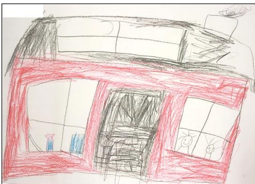
KUVA 9. Lapsen piirustus mummolasta

Piirustusten pohjalta muodostuneet viisi luokkaa olivat tapahtumapaikka, tapahtumat, henkilöt, esineet ja muut elementit sekä ilmeet (liite 5). Lisäksi tarkastelemme piirustuksissa näkyviä isovanhempien sukupuoliin liittyviä piirteitä (liite 6). Lapset piirsivät useimmiten tapahtumapaikaksi mummolan (kuva 9).