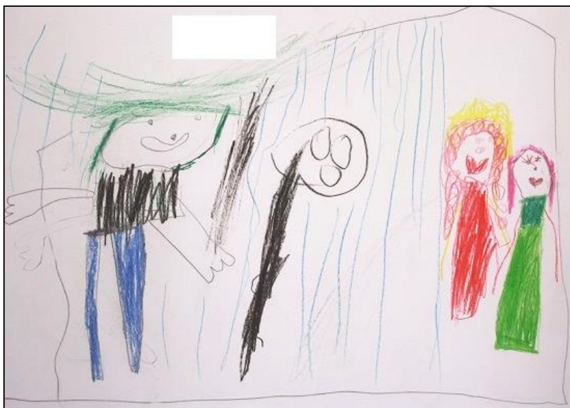
KUVA 3. Lapsen piirustus lettujen paistosta isovanhempien kanssa

Erään lapsen piirustus (kuva 3) käsitteli kokonaan lettujen tekemisen prosessia. Hän kertoi kuvasta seuraavaa: "Tässä on ukki paistamassa lettuja. Tässä on sitten se lettugrilli. Tässä ollaan mummon kanssa tekemässä lettutaikinaa, ja sitten täällä sataa vettä."