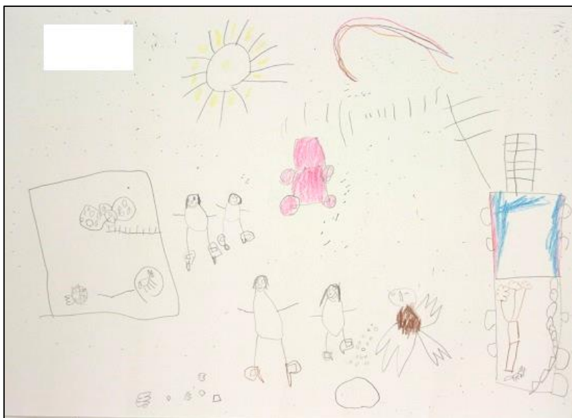
KUVA 7. Lapsen piirustus, jossa isoisä ja lapsi heittelevät kanoille jyviä

Lasten ja isoisien yhteistä toimintaa oli myös yhdessä tehdyt retket. Isoisän kanssa voi käydä uimassa ja isoisä voi viedä lapsia metsäretkelle. Isoisän kanssa tehtävät retket ovatkin usein toiminnallisia, kuten eräs lapsi kertoi: "Mäkin oon joskus käyny ukin kanssa keilaamassa." Muita arkisia hetkiä isoisän kanssa edusti lasten puheissa isoisän kanssa piirtäminen, television katselu ja leikkiminen ulkona.