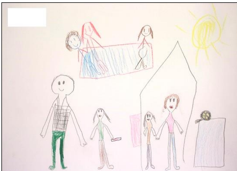
KUVA 11. Lapsen piirustus, jossa on kuvattu lapsi isovanhempiensa kanssa katsomassa televisiota, paistamassa lettuja sekä uimassa

Lähes kaikissa piirustuksissa henkilöillä oli tunnistettavat ilmeet, ja lähes jokainen näistä henkilöistä hymyili. Yhdessä piirustuksessa henkilön ilme näytti pelokkaalta. Muutamat piirustukset olivat sellaisia, joissa henkilöiden kasvoissa oli pelkät silmät tai ilmeet olivat epäselviä. Piirustusten joukossa oli muutama kuva, joissa eläimetkin hymyilivät. Hymyilevä eläin saattoi olla koira tai lehmä (ks. kuva 4).