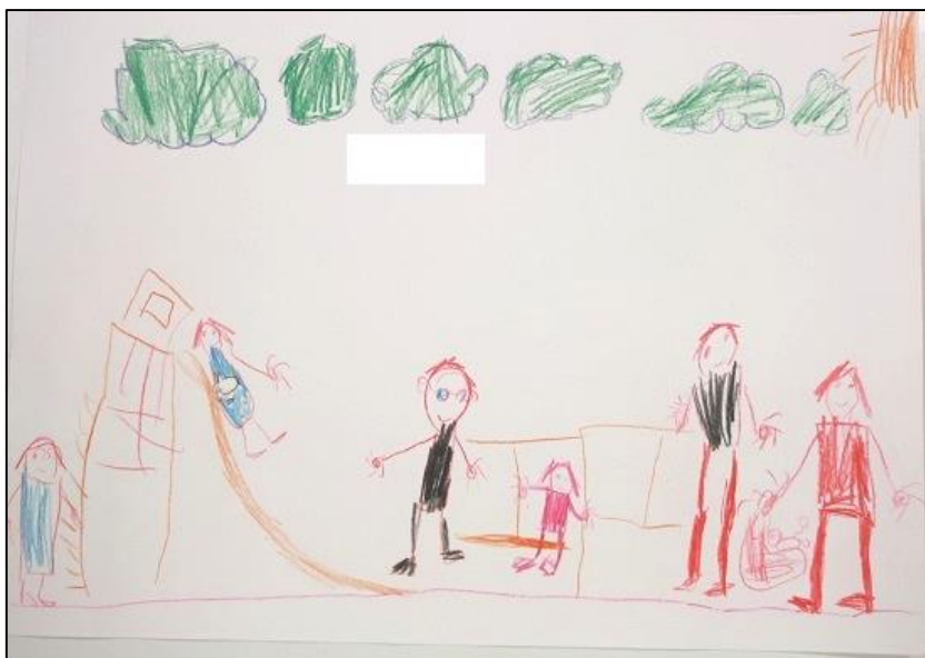
KUVA 1. Lapsen piirustus, jossa lapsi on isovanhempiensa kanssa leikkipuistossa

Lapset kokivat isovanhemman rajoittavaksi silloin, kun isovanhempi säännösteli lasten herkkujen saantia. Lasten puheissa tuli esiin se, että yleensä isovanhemmat tarjoavat herkkuja, mutta rajoittavat sitä jossain vaiheessa: "Ne ei ihan aina anna karkkia", "Eikä anna jätskiä". Rajoittavuus näyttäytyi lisäksi siinä, että isovanhemmat eivät käyttäneet lapsia kodin ulkopuolisissa paikoissa. Vastauksista kävi ilmi, että lapset eivät välttämättä puhuneet omista kokemuksistaan, vaan yleisemmin käsityksistä.