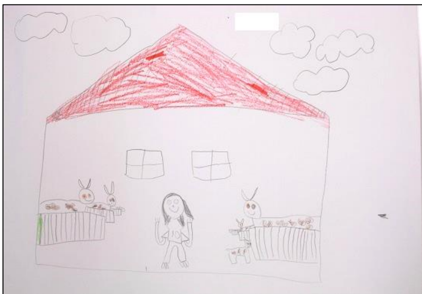
KUVA 4. Lapsen piirustus navetassa lehmien katsomisesta

lapsi oli päässyt myös katselemaan mehiläisiä isovanhempiensa kanssa isoisän harrastuksen ansiosta.