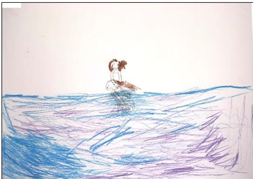
KUVA 2. Lapsen piirustus uintiretkestä isoäidin kanssa

Isovanhempien ja lasten yhteinen toiminta sisälsi ulkoaktiviteetit, retket, leikkimisen, rauhallisen toiminnan, herkuttelun, eläinten hoitamisen ja pelaamisen . Kalastus ja vesillä liikkuminen olivat suosittuja isovanhempien ja lastenlasten yhteisiä aktiviteetteja. "Käydä onkimassa, venneellä", olikin erään lapsen toteamus yhteisestä ulkoaktiviteetista isovanhempien kanssa. Uiminen ja rannalla käyminen olivat myös suosittuja tapoja viettää aikaa. Eräs lapsi piirsi hänen ja isovanhempansa yhteisen uintiretken (kuva 2) ja kertoi piirustuksesta seuraavaa: "Noo mustikkaveden ja tavallisen veden ja nii mä sukellan nii oon sukeltamassa siellä ja mummu niiku on siellä reunassa."