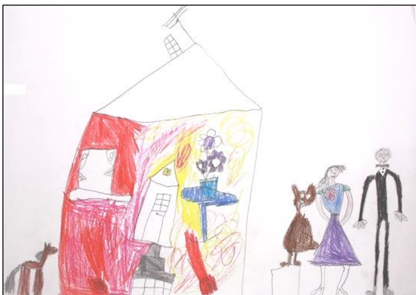
KUVA 5. Lapsen piirustus, jossa vanhemmat ovat lähdössä juhliin ja lapset tulevat hoitoon mummin ja ukin luo

vapaa-ajan menoja, kuten kuoro. Myös vanhempien lomamatkojen aikana turvauduttiin isovanhempien hoitoapuun: "Jos vaikka äiti ja isi haluaa olla rauhassa niinku lomalla niin voi sitten mennä niitten luo." Eräs lapsi kuvasi piirustuksessaan (kuva 5) tilanteen, jossa vanhemmat ovat lähdössä käymään "yhissä aikuisten juhlissa" ja toivat lapset hoitoon mummin ja ukin luo.