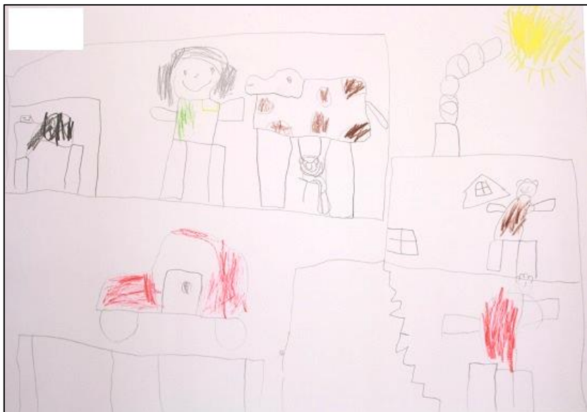
KUVA 10. Lapsen piirustus, jossa hoidetaan ja lypsetään lehmää

leikkimistä sekä leikkimistä ja pelaamista yleensä. Muita tapahtumia olivat mustikoiden poimiminen, lasten tuominen hoitoon mummolaan, vauvan hoitaminen, retkeily sekä taulujen katselu.