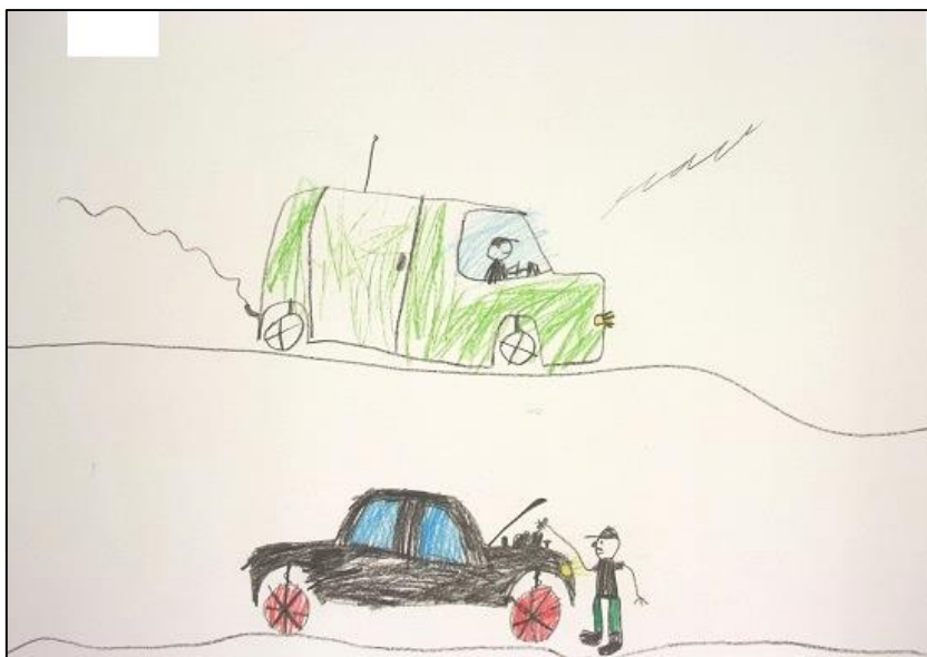
KUVA 6. Lapsen piirustus, jossa isoisä korjaa autoa

Korjaamisen lisäksi isoisät ovat taitavia rakentajia. Lasten mukaan isoisät osaavat rakentaa esimerkiksi "taloa", "ovia" ja "puuhepan ja puukarhun". Isoisän taito korjata ja rakentaa tulee ilmi seuraavassa aineistolainauksessa: