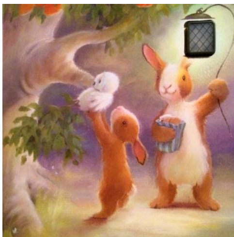
KUVA 4. Lyhdyn loisteessa (2009)

Lasta tukeva isän toimintaa ilmentää lasta osallistava periaate, kun esimerkiksi Pupu-Jussin isä luottaa ja antaa Pupu-Jussin käyttää lyhtyä auttaessaan Saukkoa löytämään hänen onkivapansa. Isä on lapsen henkisenä tukena ja vaikuttaa taustalla antaen lapsen itse ja tehdä kokeilla (ks. Kuva 4). Hän myös kannustaa ja rohkaisee.