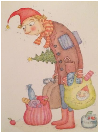
KUVA 7. Siirin jouluyllätys (2009)

sä ja lasta tukevassa isässä. Myös erilaisia perhemuotoja, kuten yksinhuoltajuutta, esiintyy ydinperhemallin lisäksi etäisässä. Isällä on yleensä päällään joko puku tai arkiset vaatteet ja hän näyttää hieman rähjäntyneeltä (ks. Kuva 7 ja 8).