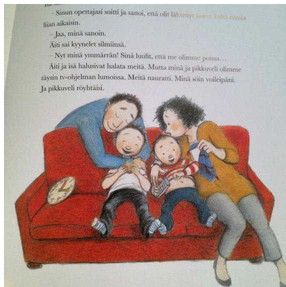
KUVA 3. Kun olimme yksin maailmassa (2009)

Höpsähtänyt isä on hassu ja hauska (ks. Esimerkki 6). Hän saattaa välillä olla väärässä tai jopa hieman ulkona asioista esimerkiksi Siirin isän kummastellessa naapurin outoa käytöstä. Vanhemman ja lapsen roolit joskus jopa vaihtuvat, kun lapset neuvovat ja ohjaavat isää tai tietävät asioista häntä paremmin (ks. Esimerkki 7). Isällä esiintyy laaja skaala erilaisia tunteita, joita hän myös näyttää vahvasti peittelemättä, kuten kesämökin ostava isä Pentti itkee ilosta lasten halatessa häntä.