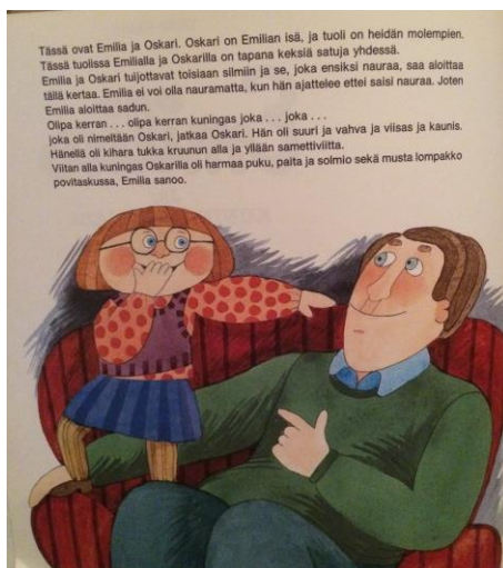
KUVA 5. Emilia ja kuningas Oskari (1980)

suorat housut ja useammilla isillä on parta tai viikset (ks. Kuva 5 ja 6).