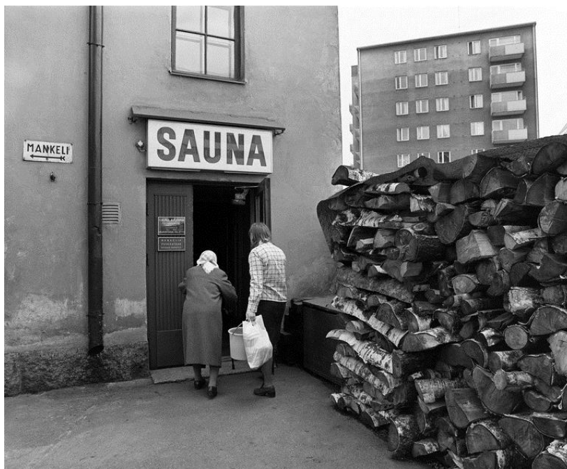
Kuva 4:saunaan menijät

Artikkelin kirjoittaja epäilee, että muutaman vuoden kuluttua ei Helsingissä ole yleisiä saunoja lainkaan, jos kehitys saa jatkua samanlaisena. Samalla se kuitenkin katsoo saunatilanteen kokonaiskehityksen terveydenhoidollisessa mielessä parantuneen, vaikka yleisten saunojen numeerinen trendi onkin ollut negatiivinen. Artikkelin lopuksi hän arvioi, että monille vanhemmille ihmisille on tarpeellista ja miellyttävää käydä ainakin peseytymässä tavallisen saunan lämmössä, jossa perusteellisen puhdistautumisen mahdollisuus on terveydenhoidolliselta kannalta erittäin merkittävää. Näistä arvoista käy ilmi, että tuona aikana yleisellä saunalla oli merkitystä ainoastaan peseytymisen ja terveydenhoidon kannalta, kuten muunkin tyyppisillä saunoilla ja kylpylöillä. Yleisesti myös ajateltiin, että yleinen sauna on vain yksi korvaava saunomismahdollisuus ihmisten arkielämässä.