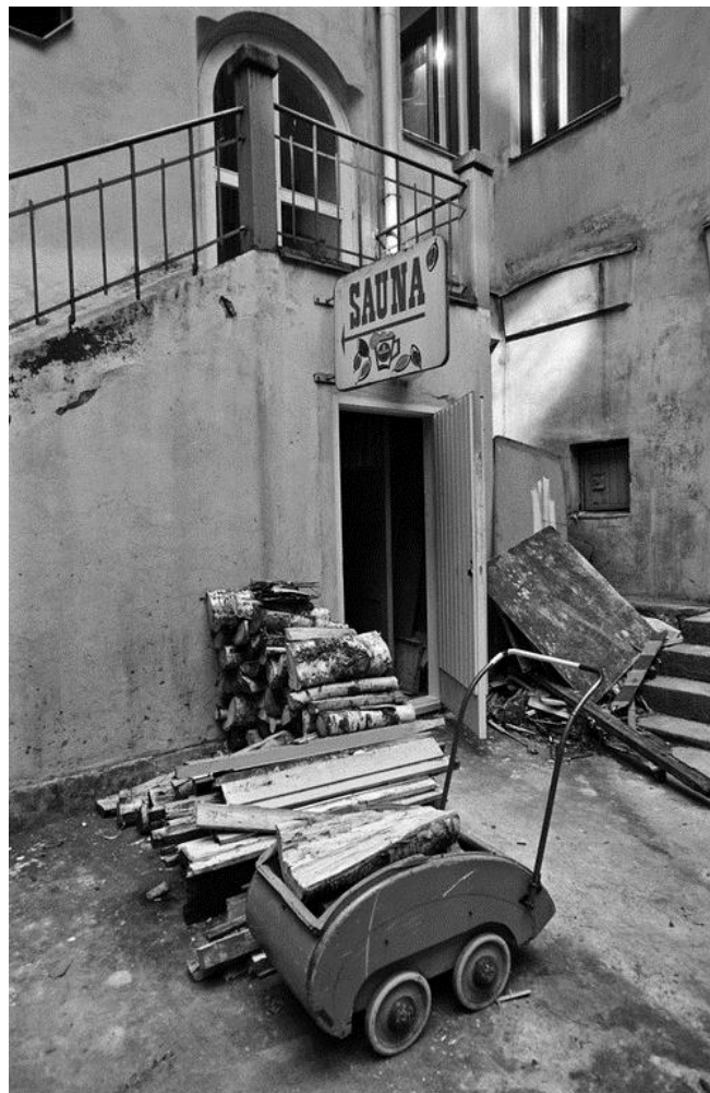
Kuva 1: Yleisen saunan ovi ja kyltti Kristianinkatu 7:n pihan puolella

Tutkimukseni toisena taustamaisemana aion pitää myös sento-kylpylä-kulttuurin historian ja sen aseman nykyajan Japanissa. Kuten edellä mainitsin, Suomen ja Japanin kylpykulttuureista löytyy paljon samankaltaisuuksia, ja oletukseni on, että molempien kulttuurien nykytilanne ja ratkaisutavat tarjoavat hyvän vertailukohteen. Näiden analyysien kautta lopuksi pohdin yleisen saunan merkityksiä ja mahdollisuuksia nykyajan ja tulevaisuuden yhteiskunnassa.