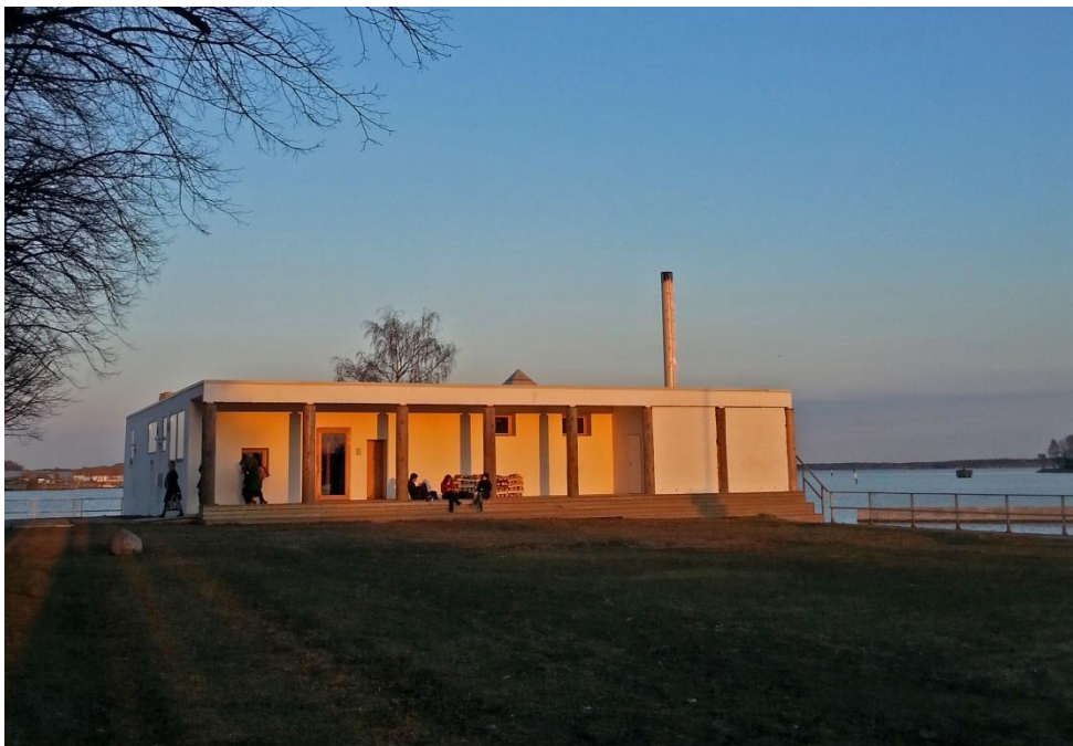
Kuva 10: Kulttuurisaunan julkisivu ja ranta