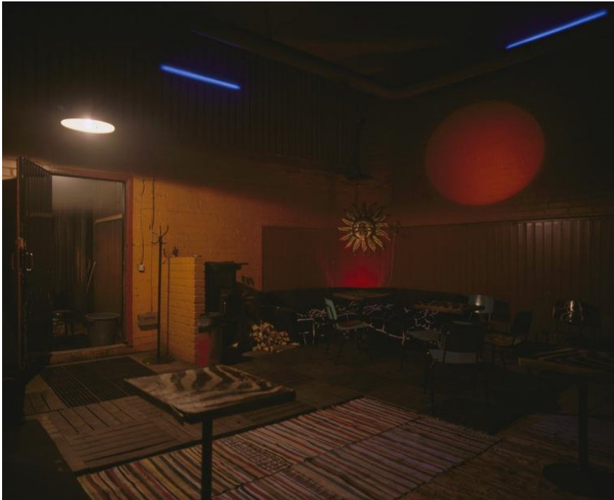
Kuva 6: Lepakkoluolan saunan oleskelutilat

1970–80-luvulla syntyi muutamia täysin uudentyypisiä ”yleisiä” saunoja, joita luonnehtivat kaupunkilaisen elämätavan merkit mm. baari, kuntosali ja klubi. Esimerkiksi Ruoholahdessa olevaan historiallisena nuorisokulttuurin ja Elävän musiikin yhdistyksen tapahtumapaikkana tunnettuun Lepakkoon rakennettiin vuonna 1981 kertalämmitteinen aito yhteissauna, joka vuonna 2013 valitettavasti tuhoutui tulipalossa. Löylyhuone näytti aivan tavalliselta saunalta, mutta esimerkiksi pukuhuone muistutti hivenen baaria, ja vaatteet laitettiin joko baaripöytien tuoleille tai pieneen naulakkoon 57 . Kuitenkin kuntosalien saunoja ja julkisissa ajanvietepaikoissa toimivia tilaussaunoja lukuun ottamatta nämä edellä mainitut uudentyypiset saunat eivät kestäneet pitkään, eikä ainakaan Helsingin kantakaupunkiin ole syntynyt merkittäviä ”oheissaunoja”.