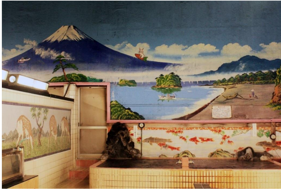
Kuva 8: Tokion Tikoku-yu (帝国湯) - sento-kylpylän kylpyhuone, jossa näkyvät iso seinämaalaukset ja värikkäät keramiikkakaakelikuviot. Seinämaalauksen aihe on Fuji-vuori, joka on tunnettu kauneimpana vuorena Japanissa, ja omistaja pyysi maalareita lisäämään myös lapsia ilahduttavia leikkisiä yksityiskohtaisia, kuten kanin ja helikopterin.

miellyttävänä maisemana, joka ilahduttaa kylpeviä asiakkaita, jotka lepäävät tai odottavat kylpykumppania. Myös rakennuksen sisätiloista löytyy monenlaisia taiteellisia koristeita, kuten kylpyhuoneen iso seinämaalaukset kansalaisesta maisemasta ja keramiikkakaakelikuviot kylpyammeen ympärillä.