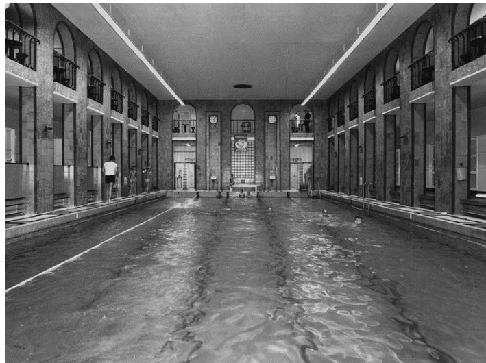
Kuva 5:Yrjönkadun uimahallin iso allas

”Monet saunanystävät eivät näitä ”saunoja” arvosta eivätkä niihin tyydy, mutta niin vain on, että ne ovat vieneet yleisiltä saunoilta asiakkaat. On sitä paitsi jo kokonainen uusi sukupolvi, joka ei muunlaisista saunoista tiedäkään.” 56