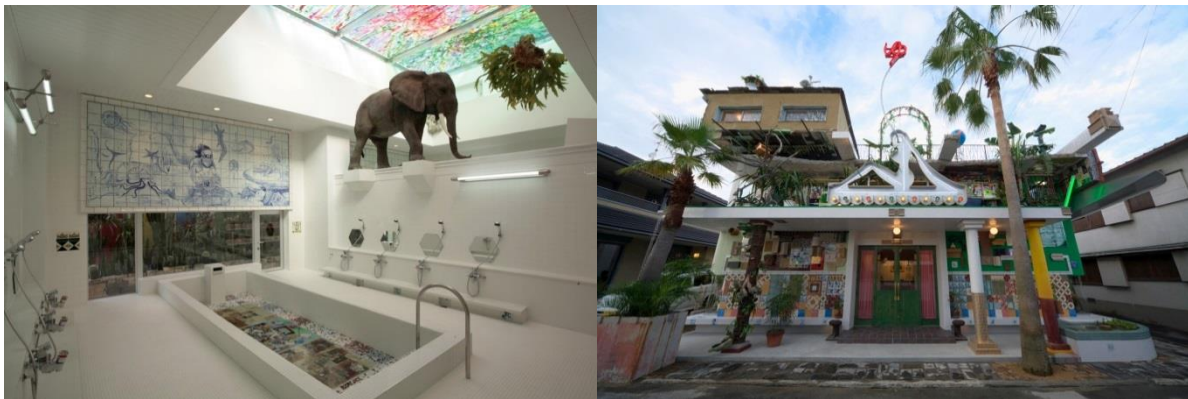
Kuva 9:Naoshiman I ♥ yu (直島銭湯アイラブ湯) - sento-kylpylän kylpyhuone ja julkisivu

Ohtake. On myös sanottu, että tämä projekti on sekä saarelaisten omistama sento-kylpylä että kokonainen taideteos 68 . Rakennuksen peruspiirre ja funktiot noudattavat perinteistä sento-kylpylän mallia, mutta julkisivuista, sisätiloista ja jopa tarvikkeista löytyy lukemattomia taiteellisia yksityiskohtaisia, joiden teemana on kohtaaminen monenlaisten muistojen kanssa helppotajuisesti kuvattuna 69 . Tämän projektin merkitys on se, että siinä yhdistettiin saaren uusi imago kulttuurisaarena ja asukkaiden arkielämän tärkeä palvelu. Kuten Ohtake kertoo, kantava päätavoite on sellaisen uuden sento-kylpylän tekeminen, jota saarelaiset rakastavat käyttää ikuisesti 70 , I ♥ yu on kohdistettu pääasiassa paikallisille asukkaille, joilta oli puuttunut siihen asti julkinen kylpylä paitsi turistien majoitukseen tähtäävät paikat, mutta I ♥ yu:ssa toki myös turistit voivat nauttia paikkakuntalaisten kanssa kylpemisestä ja taiteesta alasti.