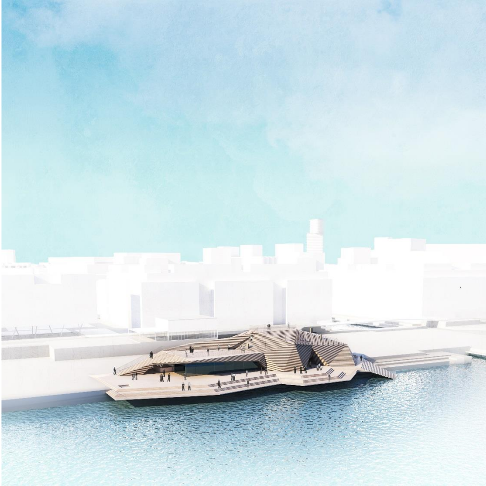
Kuva 11: Löylyn esityskuva (Kuva: Avanto Arkkitehdit Oy)