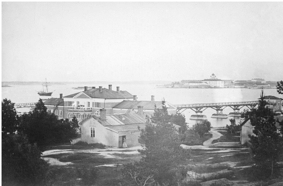
Kuva 2: Ullanlinnan kylpylä Kaivopuistossa (1870)

Jetsonen totesi kuitenkin, että yksi merkittävimmistä tapahtumista, jotka edistivät Helsingin kehittymistä yhdeksi Itämeren alueen johtaviksi kylpyläkaupungeista, on Kaivopuiston alueen kehittäminen. 30 P. A. von Bonsdorff ja Victor Hartwal perustivat vuonna 1831 mineraalivesitehtaan ja myöhemmin sen tuotteiden markkinoimiseksi perustettiin Ullanlinnan kylpylä ja Kaivohuone-nimisen huvittelurakennus. Helsingistä muodostui heti venäläisten aatelisten suosima lomakohde, koska he eivät saaneet matkustaa ulkomaille huvittelemaan.