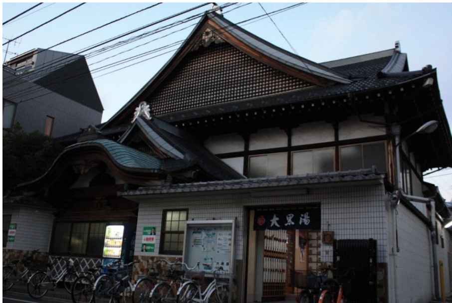
Kuva 7: Tokion Daikoku-yu(大黒湯) - sento-kylpylän julkisivu, jossa näkyvät tyypilliset miya-zukurin yksityiskohdat

Suuri osa nykyaikaan säilyneistä sento-kylpylöistä avattiin yrityksenä Meiji-kaudella (1868–1912), ja niiden perusta rakennettiin Showa-kauden (1926–1989) alussa 61 . Kuitenkin on ajateltu, että erikoinen arkkitehtuurityyli nimeltään miya-zukuri (宮造り), joka on säilynyt nykyaikaan asti Tokion sento-kylpylöissä, on kehitetty Taisho-kauden (1912–1926) loppupuolesta Showa-kauden alkupuoleen asti 62 . Miya-zukuri-tyylille on tunnusomaista vanhan temppelin tai linnan näköinen julkisivu, jolla on chidori-hafu(千鳥破風) niminen suuri kolmionmuotoinen pääkatto, sen alapuolella oleva toinen kaarimuotoinen katto nimeltään kara-hahu(唐破風) ja niiden välillä näkyvä taiteellinen puinen kohokuvakoriste nimeltään gegyo(懸魚). Katosta nousee pitkä ja uljas savupiippu, johon kirjoitetaan yrityksen nimi ja myös pääoven edessä roikkuvat kylttiverhot.