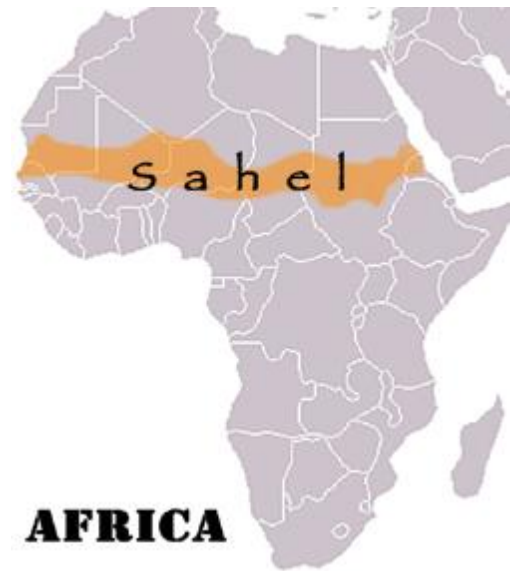
Kartta 1. Sahelin alueen kartta.

tuhanteen kilometriin. Sahelin alueella sijaitsee useita valtioita tai niiden osia, joiden usein ajatellaan muodostavan jonkinlaisen geopoliittisen kokonaisuuden. Tulee silti muistaa, ettei se ole niin sanotusti yksi poliittinen kokonaisuus vaan suuri ja vaihteleva alue. Edellä mainitusta syystä Sahelin alueen määrittely ei ollut eri lähteissä täysin yhteneväinen. Siitä, mitkä valtiot kuuluvat Sahelin alueeseen on erilaisia tulkintoja. Valitsin tutkimukseni pohjaksi YK:n Maailman ruokaohjelman (WFP) sivuilta löytyneen listauksen maista, joita Sahelin kriisi (”The Sahel crisis”) koskettaa (WFP, 2012). Tässä tutkimuksessa tulkiten siis niin, että Saheliin kuuluvat Niger, Mauritania, Tsad, Mali, Burkina Faso, Senegal, Kamerun sekä Gambia. Tein valinnan tällä perusteella jo sen takia, että tarkoitukseni on tehdä sosiaalipoliittista tutkimusta, ei geologista.