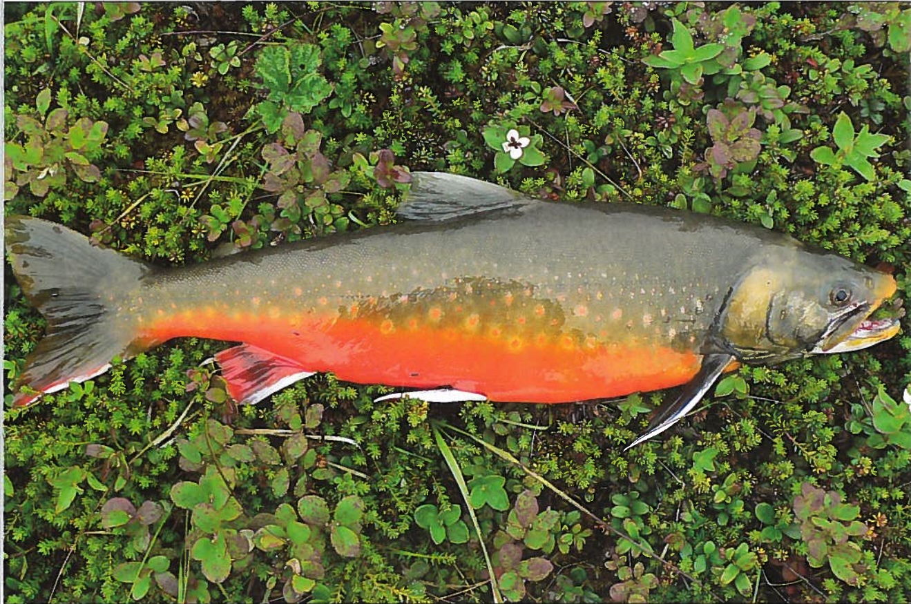
Nieriä on merkittävä kalalaji niin paikallisten ravintona, turistien saaliina kuin tunturijärvien eliöyhteisöjen kannalta.