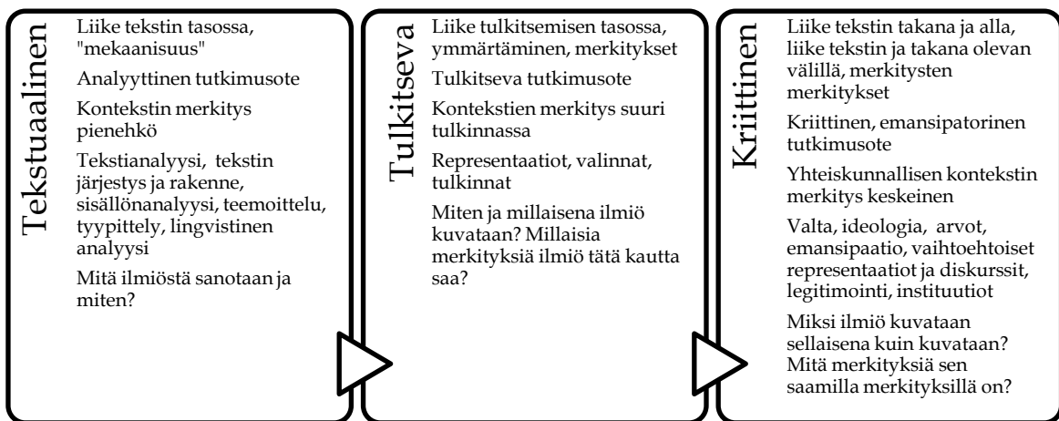
KUVIO 3 Diskurssianalyysin vaiheet

Diskurssianalyysia voi lähestyä syvenevänä prosessina, joka käynnistyy tekstuaalisella, tekstin tasossa liikkuvalla analyysillä. Tutkijan suhde tekstiin on analyttinen ja analyysissa hyödynnetään empirististä, havainnoivaa otetta. Tutkija lukee aineistoa ja tekee huomioita sen sisällöstä, rakenteesta, järjestyksestä sekä lingvistisistä tekijöistä. Teksti itsessään on fokuksessa: sanat, ilmaukset, lauseet, virkkeet, metaforat sekä selonteot kokonaisuutena. Analyysin konteksti on tilanteinen, paikallinen ja tekstuaalinen, mikrotasoinen. Tutkijan analyysissaan tekemät johtopäätökset (mm. luokittelut) lisäävät analyysiin myös hieman tulkinnallisuutta. Tutkimusote on kuitenkin neutraali ja siinä tehtävät johtopäätökset ovat objektivistisempia kuin myöhempien vaiheiden ratkaisut. Analyysin tuloksena syntyy tekstin perusrakenteen, sen kantavien teemojen ja ominaisuuksien luokittelu, jonka perusteella voidaan