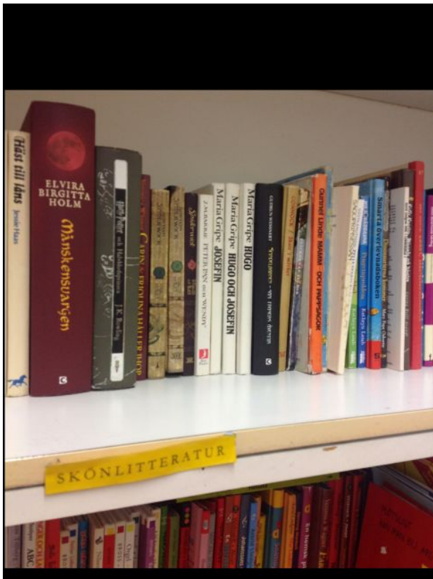
Bild 3: Svenska dominerar klart i klassrummet men samsas också med finska och engelska (se datorskärmen). Det ena klassrummet har en avdelad bokhylla vars utbud möjliggjorts av gåvor från familjer och med inköpsstöd från Kulturfonden.

Lärarna har alltså ett styvt jobb med att undervisa elever med språkligt brokiga bakgrunder och i olika åldrar, där varje årskurs har sin läroplan. Det kräver flexibel planering (jfr bild 2 ovan). Den ena läraren undervisar samtliga elever i ämnet finska från och med årskurs 3, anpassat efter elevens språkliga bakgrund (s.k. modersmålsinriktad finska eller finska som andra inhemska språket ) medan den andra läraren undervisar alla i engelska som främmande språk från årskurs 5. Eleverna läser ämnena slöjd och musik integrerat med finska elever från skolan och undervisningen sker då helt på finska av finskspråkiga lärare. Detta fungerar enligt lärarna utan problem. Man har ändå varit noga med att läsåmnena (jfr matematik i bild 4) undervisas på svenska. Trots heterogeniteten i klassen och komplexiteten i schemaläggning och planering, trivs både lärare och elever med den lilla storleken på den svenska undervisningsgruppen: ”det finns arbetsro, eleverna får mycket uppmärksamhet av läraren och samhörighetskänslan i gruppen är stark”.