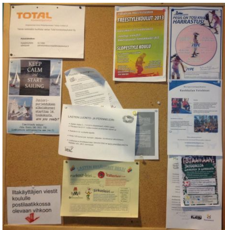
Bild 5: Skyltar (liikunta-/juhlasali = gymnastik- och festsal) och meddelanden i de allmänna utrymmena är på finska. Till höger syns en anslagstavla med information om möjliga fritidsaktiviteter.