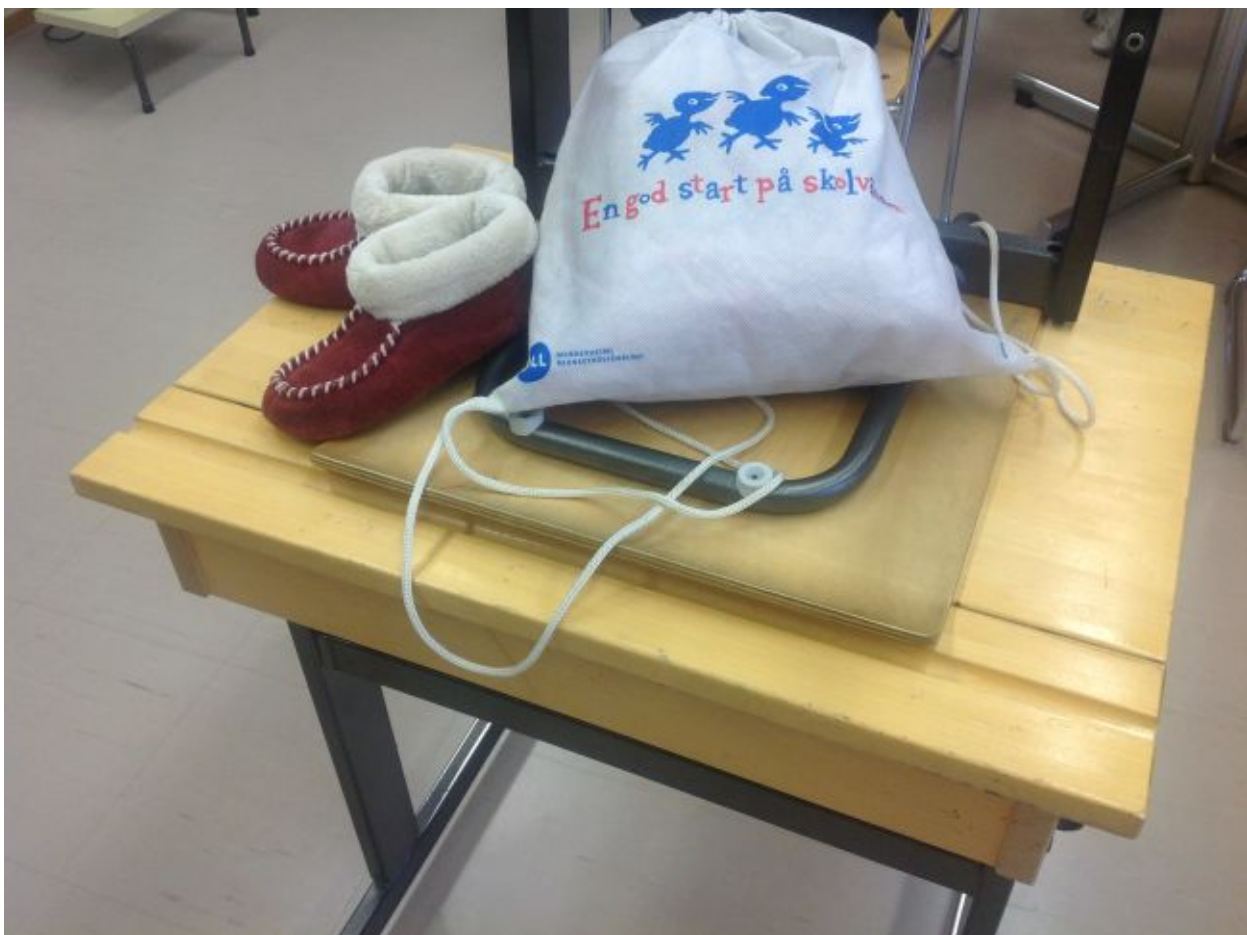
Bild 6: En andraklassares skoldag är över. På gymnastikpåsen står det ”En god start på skolvägen”.

Slutligen frågade jag en av lärarna – som verkat i den svenskspråkiga skolan nästan sedan starten – hur samarbetet med den finska sidan av skolan upplevs. Hon menade att lösningen minskar den administrativa bördan och gör att de kan fokusera på det som är deras uppgift: att planera och genomföra god undervisning. ”Vi har inget behov av att finnas i en separat skola. Vi har inget att förlora på det här i Jyväskylä. Det finns många resursfördelar med det här sättet.” Hon uppskattade också den dagliga kontakten med de finskspråkiga kollegorna i lärarrummet. Kanske är det så att den svenska klassen vid Pohjanlammen koulu i Jyväskylä i dag är det närmaste vi kommer en tvåspråkig (svensk/finsk) klass?