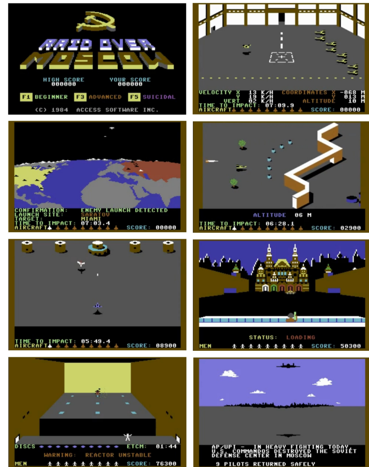
Kuva 1. Kuvakollaasi Raid over Moscow 'n kentistä

vain minuutteja aikaa tuhota robotti ja poistua reaktorihuoneesta ennen ytimen sulamista. Pelaajan päästessä viimeiseen kenttään on pelillä kaksi erilaista loppuvaihtoehtoa. Jos pelaaja ei ehdi tuhota viimeistä robottia, tulee hänen kommandoryhmästään sankarivainajia. Jos pelaaja onnistuu tuhoamaan viimei-senkin robotin ja pääsee pakenemaan, hänen kommandoryhmäänsä odottaa kotona sankariparaati. Molemmissa vaihtoehtoissa Kreml on historiaa.