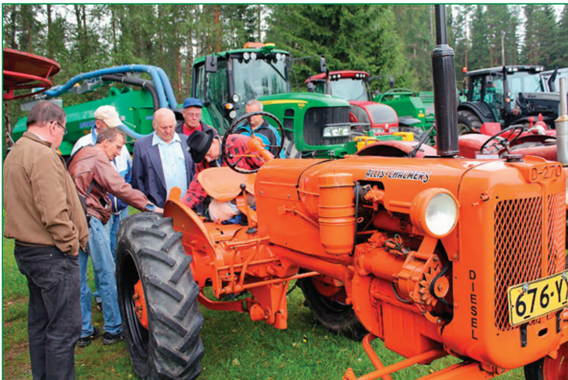
Osaavat kylät -tapahtuma.

Osaavat kylät -tapahtuma järjestettiin elo- kuussa 2012 Alajärven itäisellä alueella, Koivumäen kylässä. Koivumäen lisäksi tapahtu- massa olivat mukana naapurikylät Uusikylä ja Möksy. Ajatus itäisen alueen omasta kyläta- pahtumasta lähti tarpeesta viritellä yhteistyö- tä kaukana kaupungin keskustasta sijaitseval- la alueella, jossa lähipalvelut kuten kyläkoulut ovat olleet leikkurin alla eikä ainoan jäljelle jääneenkään tulevaisuus ole turvattu. Alueelle kaivattiin uusia tuulia yhteisöllisyyden herät- tämiseksi. Aluksi tapahtuman tiimoilta pidet- tiin kaikille avoimia ideointikokouksia, joihin osallistui ensin vain muutama aktiivi, mutta kokousten edetessä väkeä tuli yhä enemmän. Kun yhteisen kylätapahtuman toteutus lo- pulta lyötiin lukkoon ja alkoi käytännön teh- tävien jakaminen, innokkaita vapaaehtoisia ilmaantui mukaan sankoin joukoin. Itäisen Alajärven alue on tunnettu kädentaitajistaan, joten paikallisen osaamisen esille nostaminen koettiin hyväksi teemaksi tapahtumalle, siitä myös tapahtuman nimi Osaavat kylät . Kaikki Koivumäen, Uusikylän ja Möksyn asukkaat toivotettiin tervetulleiksi esittelemään osaa- mistaan ja myymään tuotteitaan tapahtumaan