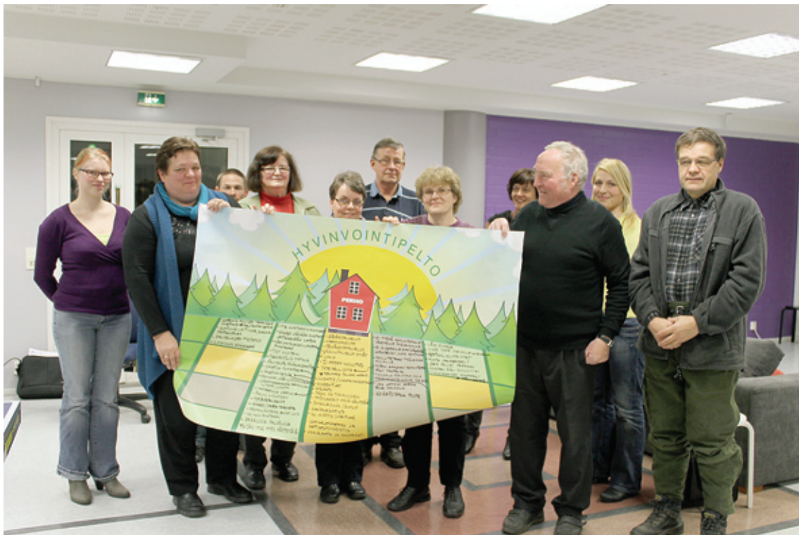
Perhon hyvinvointipelto näyttää tältä.

Fyysisesti hyvinvointipelto on iso, mainostoimistossa teetetty värikäs paperilakana. Kuvassa on lähes kokonaan paperin täyttävä peltoaukea, jonka reunalla on metsää. Keskellä on yksi iso punainen talo, jonka seinällä lukee kyseisen kunnan nimi. Metsän takaa, siniselle taivaalle nousevassa auringossa lukee teksti Hyvinvointipelto . Hyvinvointipelto rakentuu kolmessa eri kasvuvaiheessa olevasta peltopalstasta. Ruskeassa mullospellossa ei kasva mitään. Vihreässä pellossa olevat asiat alkavat olla oraalla, mutta vaativat edelleen erityistä huolenpitoa. Keltaisessa pellossa päästään puolestaan nauttimaan kypsän viljan antimista. Salaojia rakentamalla eri peltojen välille voidaan luoda yhteyksiä. Keskustelun kuluessa alueellinen kehittäjä kirjasi osallistujien ajatuksia ja sijoitti ne eri pelloille sen mukaan, miten osallistujat itse päättivät. Esimerkiksi jos