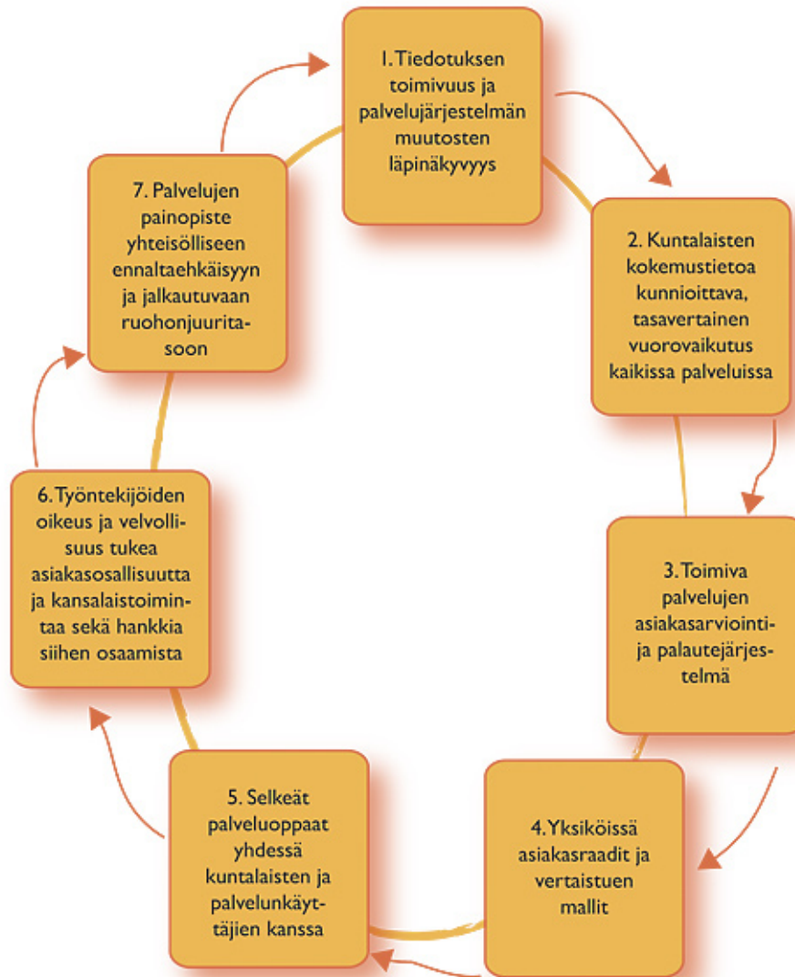
Kuvio 3. Osallisuutta tukevan sosiaali- ja terveystoimen laatutekijät

Jo KAMPA-hankkeen edellisissä valmisteluvaiheissa korostuivat tiedonvälityksen ja tasavertaisen kohtelun tärkeys. Niiden merkitys vahvistui nyt toteutetun KAMPA-vaiheen aikana. Luottavaisesti voi olettaa, että asiakasarvioinnista, asiakasraadeista ja erilaisista muista kokemustietoa hyödyntävistä käytännöistä on tulossa uusi vahva palvelukulttuurin osa myös lainsäädännön ja kansainvälisten esimerkkien vaikutuksesta. KAMPA-hankkeessa ei vielä kovin hyvin onnistuttu sosiaali- ja terveystoimen kaikkien työntekijöiden saamisessa mukaan osallistavien mallien kehittämiseen, johtuen osin myös lähes sietämättömiksi kiristyneistä työpaineista organisaatioissa. Päätöksiä tekevien ja johtavien virkamiesten