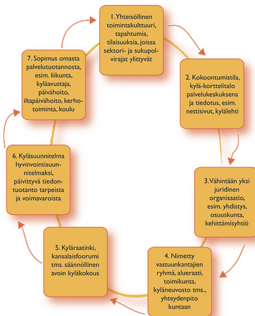
Kuvio 2. Paikallisyhteisön osallistumista tukevat lähipalvelujen ja lähidemokratian laatutekijät

Kuvion nuolien syklinen rakenne havainnollistaa ennen kaikkea kuitenkin ns. ”hyvän kehää” (Gunnar Myrdal 1957). Tämä kansainvälisessä hyvinvoinnin tutkimuksessa paljon käytetty käsite tarkoittaa KAMPA-hankkeen yhteydessä sitä, miten paikallistason yhteisöllisyys ja yhteistoiminnallisuus vahvistavat infrastruktuuria, joka mahdollistaa uudenlaista toimintaa, joka puolestaan heijastuu hyvinvoinnin ja yhteisöllisyyden määrän ja laadun voimistumisena.