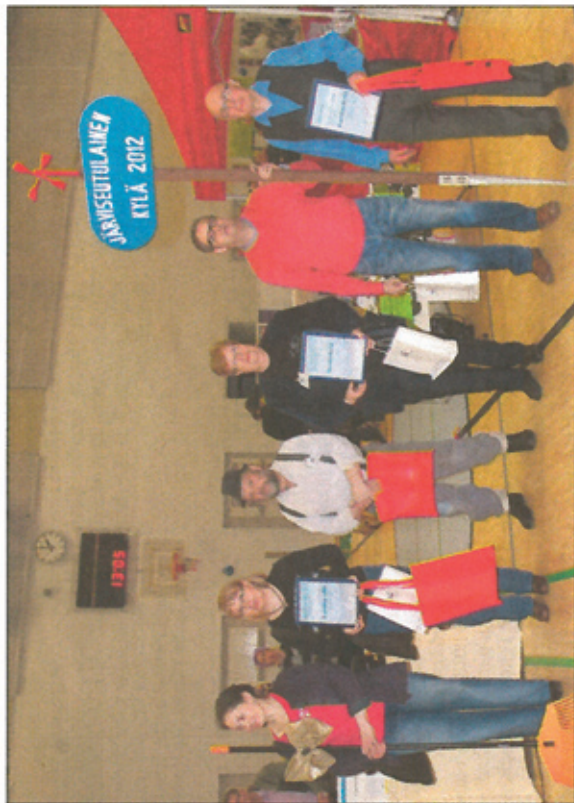
Kyläkilpailun kunniakirjoja ja muistamisia vastaanottamassa vas. Alajärven Luoma-ahon, Soinin Hautauskylän ja Alajärven Rannankylän kyläyhdistysten edustajat.