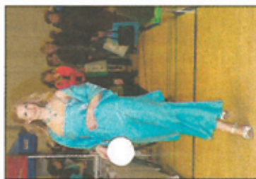
Muotinäytös oli jälleen yksi messujen kohokohtia.