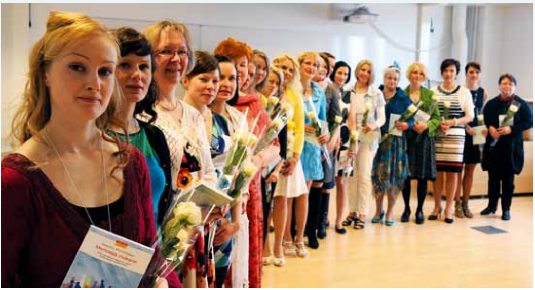
20 uutta erityisopettajaa sai opintonsa päätökseen keväällä.