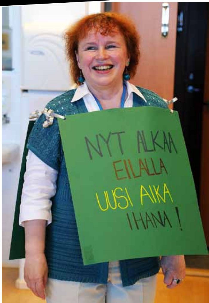
Opiskelijoiden hyvästelyriimitteilyjen mukaisesti "tää psykologi ei tunne kiirettä, ahaa, ahaa, tää psykologi ei tunne kiirettä, ahaa, ahaa".

Chydenius-instituutti, myöhemmin yliopistokeskus, on dynaaminen oppiva organisaatio, jossa oli todella hienoa työskennellä yhtenä asiantuntijana. Tutkimtoon johtavat koulutukset ja avoin yliopisto kehittivät yhteistyössä aikuispedagogiikkaa. Saimme hyvää palautetta korkeakou-