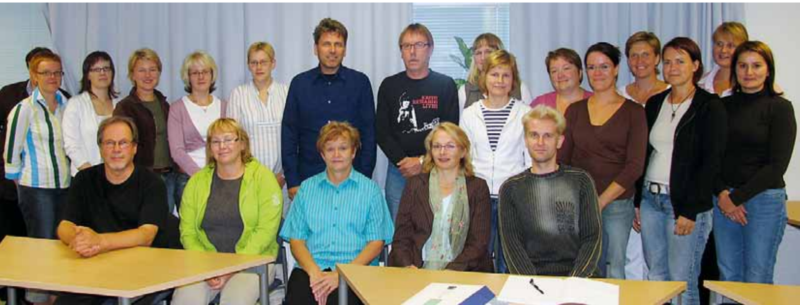
Ensimmäiset sosiaalityön maisteriopiskelijat aloittivat yliopistokeskuksessa syksyllä 2006.