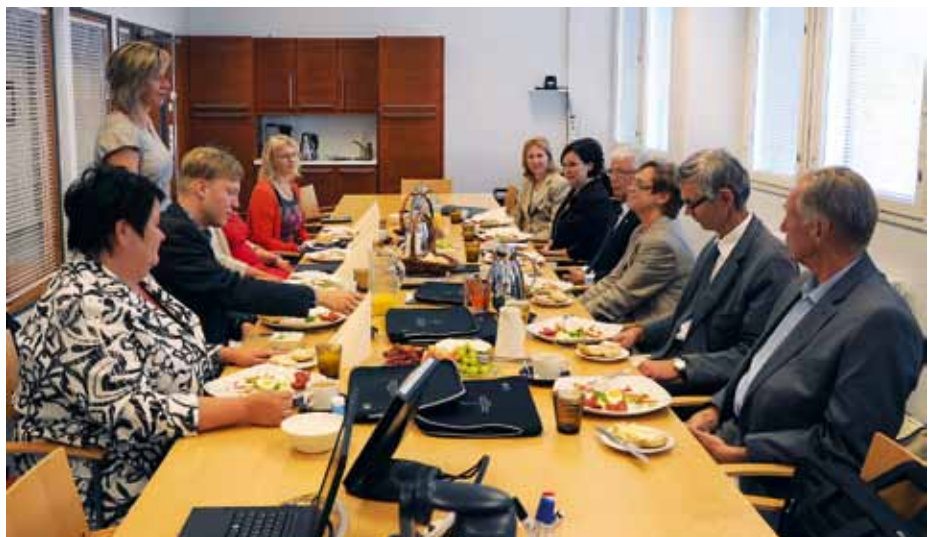
Hallitus brunssilla yliopistokeskuksen johtoryhmän jäsenten kanssa.