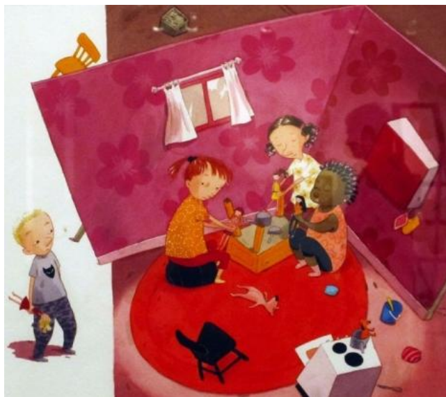
Bild 5. I bilden har flickorna det trevligt men Kenta ser osäker och blyg ut. Lindenbaum har fångat känslan av utanförskap i bilden.

Bokens tema är genus och jag anser att boken kan definieras som problemorienterad eftersom temat eller problemet genus är så uppenbart och enligt min mening också pedagogiskt. Även om boken handlar om de olika förväntningarna för pojkar och flickor, och följer en pojke som vill leka med barbie dockor, är det kvinnliga och det manliga tydligt representerade i boken och nästan alla personer i boken följer de rådande genusnormerna. Kentas pappa är en stor och maskulin man som tycker att Kenta ska spela fotboll. Flickor och pojkar leker i avskilda grupper. Pojkarna på daghemmet har blåa eller svarta kläder och kort hår medan flickorna har färgglada kläder med blommor på och de har långt hår. Pojkarna spelar fotboll, leker krig och gör sönder saker, alltså är deras lekar aktiva, aggressiva, våldsamma och tävlande. Flickorna leker med barbie dockor som simmar och föder barn. Det är dockorna som utför aktiviteterna inte flickorna själva som är passiva i leken. Flickorna klär sig i fina kjolar och vill vara vackra.