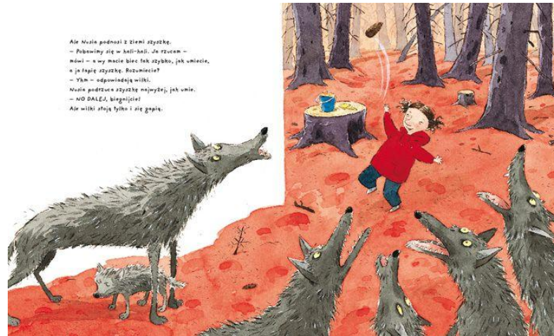
Bild 1. I leken är det Gittan som har makt. Alla illustrationer i böckerna som jag analyserar är gjorda av Lindenbaum, och hon har gett mig lov att använda bilderna i avhandlingen.

Östersund (2008: 100) påpekar att lek omfattar ett moment av makt och det gäller vem som får bestämma lekens regler och vilka maktkonstellationer som iscensätts i leken. I verkligheten var Gittan lydig och följde dagisfrökens regler som ledde till att hon gick vilse i skogen, men i lekvärlden är det hon som har makt. Gittan lagar mat till vargarna och söver vargarna, hon tar hand om dem och försöker få vargarna att känna sig trygga. På det sättet känner Gittan sig tryggare fast hon har gått vilse. Östersund (2008: 100) påminner att barn inte leker enbart för att det är lustigt utan också för att lösa konflikter mellan förhoppningar och realiteter. Man kan tolka det så att Gittan skulle vilja vara modigare och när hon möts av en skrämmande händelse hittar hon sin inre lekvärld och blir modig i leken. Vargarna som kommer till Gittans hjälp är Gittans sätt att prata till sig själv och trösta sig. Vargarna tar hennes känslor av rädsla, de vågar inte klättra ner från träd precis som Gittan inte vågar klättra på tak men i leken hjälper modiga Gittan vargarna ner. När Gittan hittar sitt daghem själv kan hon bli modigare i verkligheten, hon har väl klarat sig i den farliga skogen och då kan hon säkert klara annat också. På sista sida står Gittan på taket av lekstugan och ler. Hon har vunnit sin rädsla.