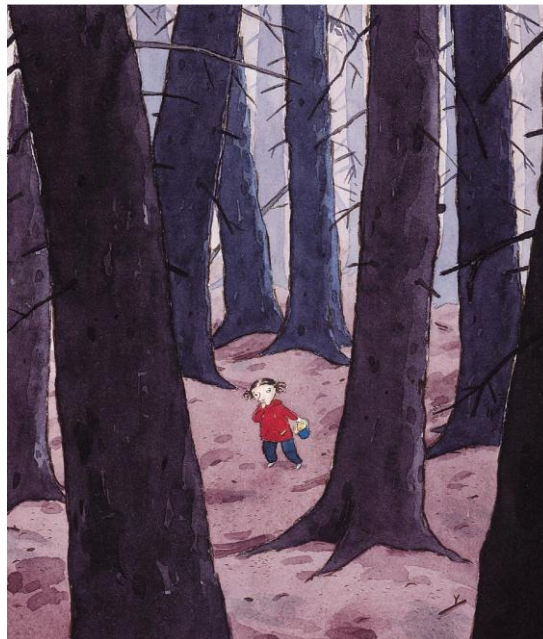
Bild 2. Gittan märker att hon har gått vilse i skogen

Gittans fantasi och lek konkretiseras i bilderna. När Gittan märker att hon har gått vilse blir skogen i bilden mycket hög, som understryker Gittans rädsla. Förändring av bakgrundsfärgen i bilderna