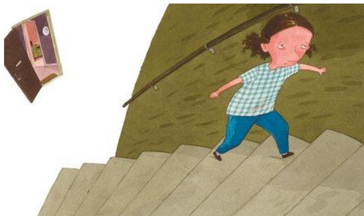
Bild 3. Det känns som is i Gittans kropp och hon rusar hem upprörd

Gittan har en kompis, Hjärdis, som inte går på dagis utan får vara hemma med en barnvakt. Det finns två dagbarn hos Hjärdis som barnvakten passar. Barnvakten heter Puma och Gittan beundrar henne. En dag går Gittan till Hjärdis hem. Hjärdis springer omkring i huset men Gittan vill stanna i köket där Puma är. När dagbarnen sover middag skulle Gittan vilja stanna i köket och kolla när Puma läser men Hjärdis vill hitta på någonting. Hjärdis bestämmer att de går och skämmer de sovande dagbarnen och ritar på deras huvuden fast det är förbjudet. Gittan gör inte det utan tittar bara det som Hjärdis gör. När Hjärdis blir trött på leken ska de bära dagbarnen tillbaka till sängen. Gittan lyfter upp ett av barnen men det råkar ramla i golvet och börjar skrika högt. Puma kommer rusande in i rummet och ropar ”Vad har du gjort!”. Då känns det som is i Gittans kropp. Gittan springer hem men kan inte berätta vad som har hänt när pappa frågar det. Gittan vill gömma bort sig och det finns ett rum i huset där Gittan brukar vara när hon måste tänka någonting viktigt. Då framträder sex uttrar till hennes sällskap och försöker att få henne att må bättre. Uttrarna vill bli kastade i luften och Gittan kastar dem högre och högre. Uttrarna vill ramla i golvet och de gillar att slå sig hårt. I mitten på deras vilda lek ringer det på dörren och Puma, Hjärdis och dagbarnen har kommit att bjuda Gittan hem till sig att äta glass. Puma lovar att rita på Gittans arm.