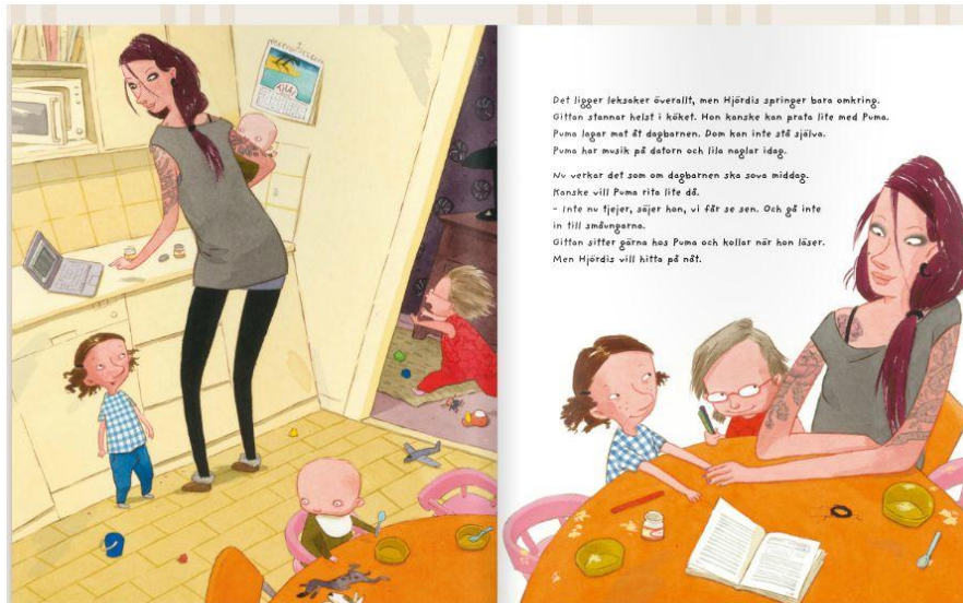
Bild 4. Gittan tittar beundrande på Puma

Bilderboken ger författaren möjlighet att inte säga allt i text och Lindenbaum använder bilder för att skapa känslor och komplettera berättelsen. På tredje uppslag står det ”Gittan stannar helst i köket. Hon kanske kan prata lite med Puma.” och bilden kompletterar texten med Gittans beundrande blick.