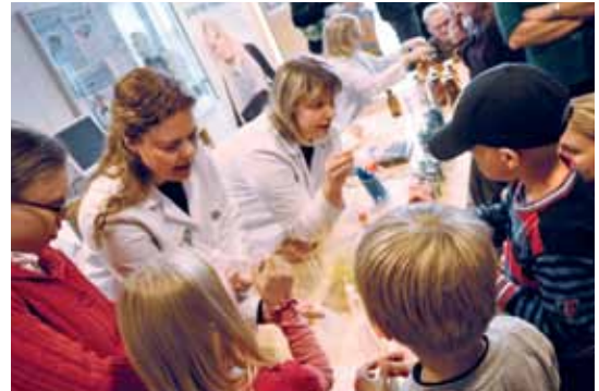
Kemian kirjaston aulassa kävi innostunut viilke, kun lapset ja aikuiset kävivät kurkistamassa molekyylien maailmaan.