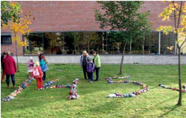
Oppilaiden maalaamista kivistä koostuva tilalaideteos kertoo, kuinka vanha Norssin alakoulu on.