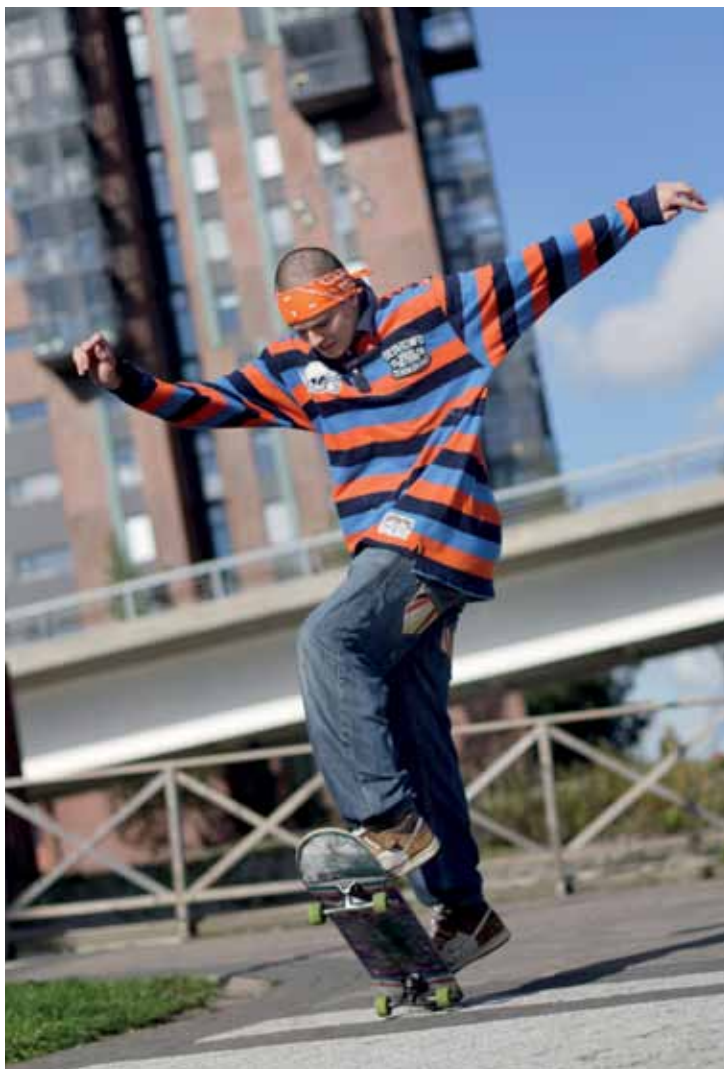
Skeittaus on nuorison itsensä tekemää kulttuuria.

– Varmasti jonkin verran tapahtuu onnettomuuksia – sellainen on tempullisuuden hinta. Mutta eiköhän monen tunnin lautailu käy hyvästä kuntoilustakin, Itkonen arvelee. Liikunnallisuuden lisäksi merkittävänä asiana hän pitää lajin yhteisöllistä luonnetta, joka on omiaan