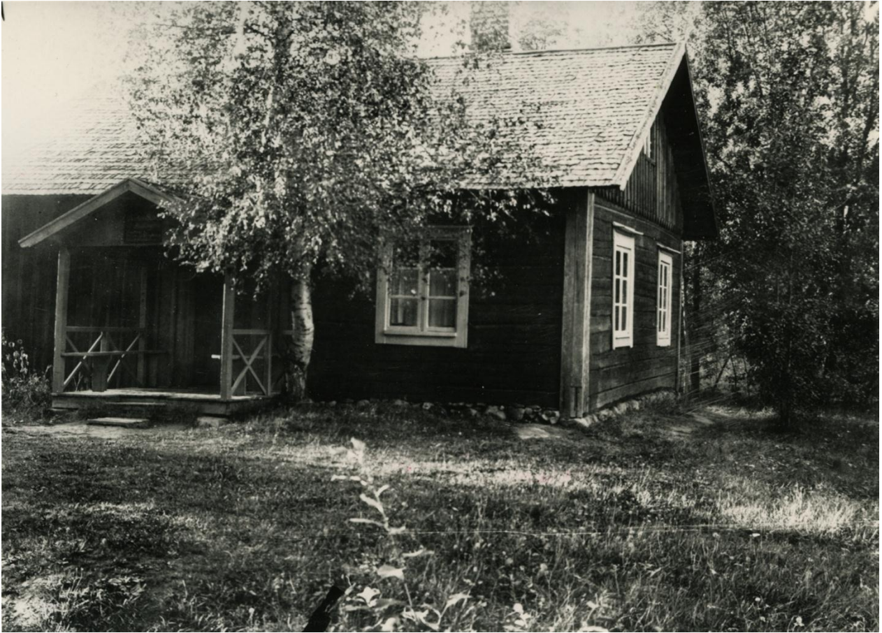
Aleksis Kiven kuolinmökki vuonna 1939. Kuvassa samana vuotena tehdyissä korjauksissa esiin otettu hirsiseinä.