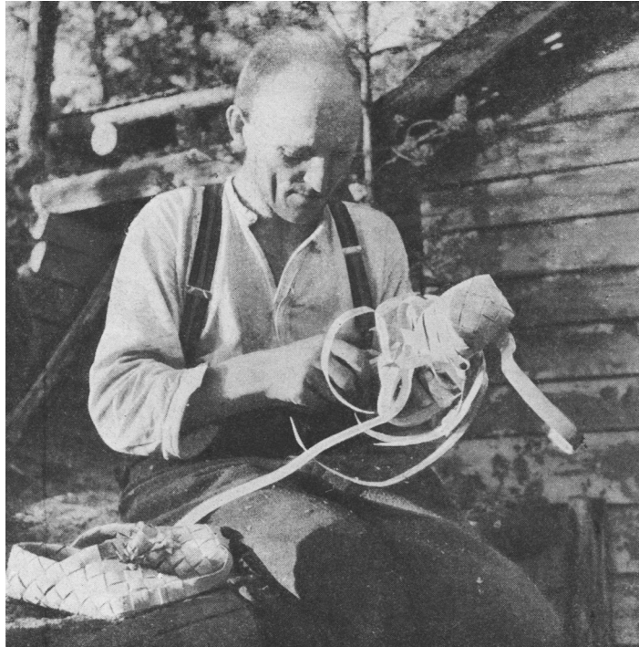
KUVA 2. Tuohivirsu syntyy. Kotiteollisuus-lehdessä oli tyypillistä esitellä perinteisten tekniikoiden taitajia ja selvittää perinteisten tuotteiden valmistamista. Kotiteollisuus 9-10/1945, s. 95.