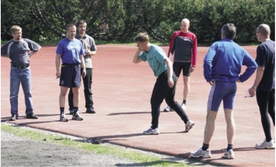
Mr. ja Ms. Ambiotica -urheilukilpailuun kuuluu useita lajeja. Kesäkuussa kilpailtiin yleisurheilussa.