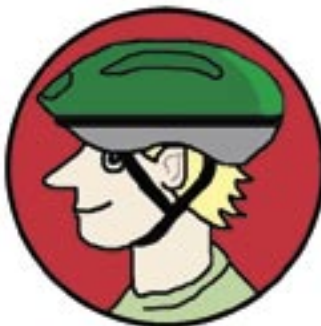
PIIRROS: JONNA MARKKULA

vain noin 20 prosenttia pyöräilijöistä käyttää kypärää. Se on tosi vähän, pahoittelee Vuoriainen. -KMN