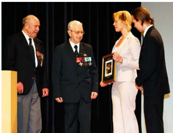
Normaalikoulun yläaste ja lukio haluavat tukea taksvärkityöllään veteraaneja.