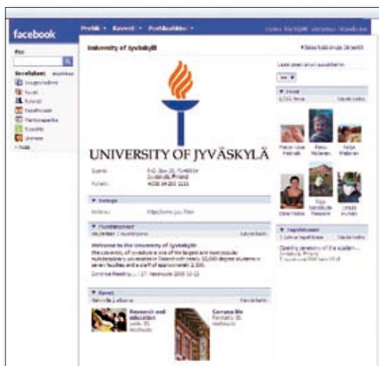
Facebookista löytyy myös Jyväskylän yliopiston fanisivu.

– Väistämättä esiin tulee kielteisiäkin asioita. Olemme esimerkiksi viestinnän laitoksella googlanneet valintakoikeiden aikaan, mitä keskustelupalstoilla kokeista puhutaan, tunnustaa Siitonen.