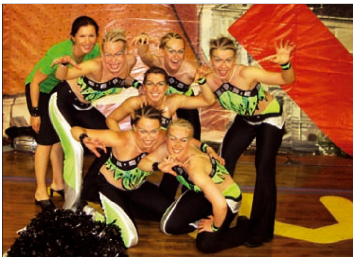
Campuksen Koonnon joukkue sijoittui viidenneksi cheerleadingin EM-kilpailuissa heinäkuussa.