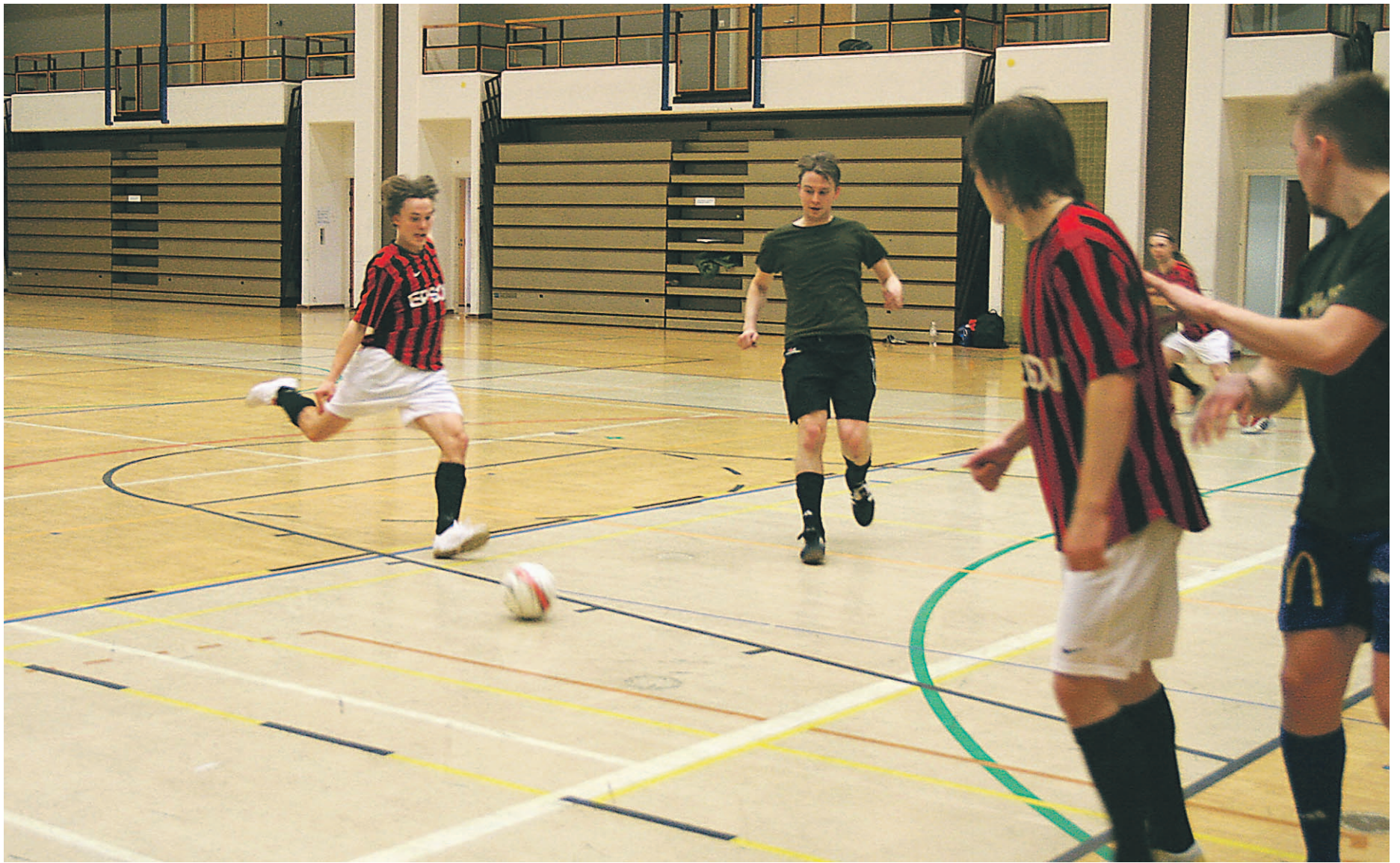
Kampuksen Dynamon raitapaidat hiovat taktiikkaa ja pelikuntoa Huhtaharjun liikuntasalissa.