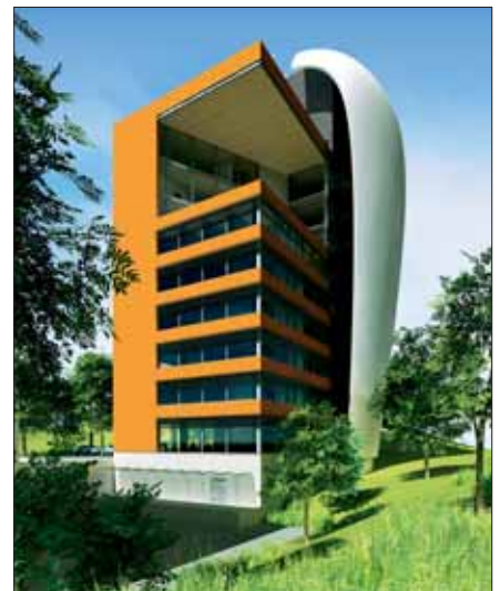
LUONNOSKUVA HELIN &amp; CO ARKKITEHDIT