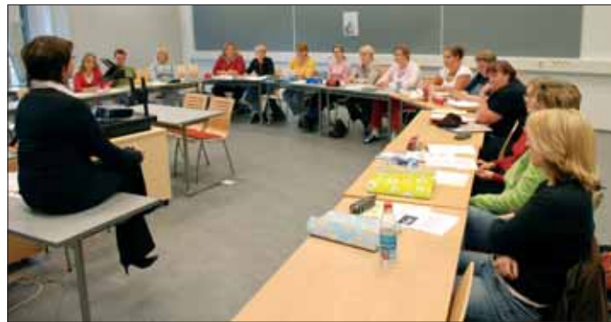
Opiskelijat viihtyvät uusissa, valoisissa luokkatiloissa.

Yliopistokeskusrakennuksen perusideana on keskusaula jokaisessa kerroksessa. Aulatilalla on koko rakennuksen korkuinen ja suuri lasiseinä tarjoaa hienon näkymän sekä ulos että muihin kerroksiin. Arkkiteh-