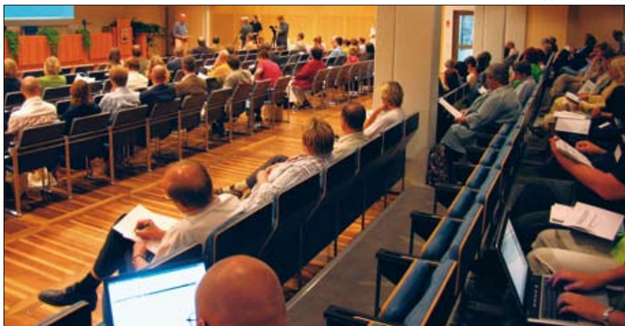
Lähes sata maaseutututkijaa kokoontui Kokkolassa.