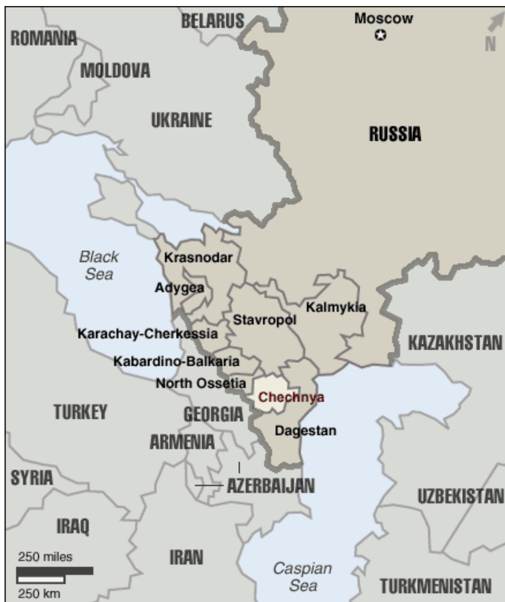
Kuva 2. Kaukasuksen tilkkutäkki on strategisesti merkittävää aluetta.

Kuva 2.