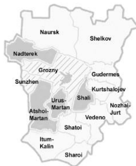
Kuva 1. 1994 elokuussa Väliaikaisneuvoston hallussa olleet alueet. Harmaalla ovat täydessä hallinnassa olleet ja viivoituksella osittain hallussa olleet.

Dzhohar Dudajevin vastainen oppositio oli hyvin monenkirjava. Erilaisten ryhmittymien poliittiset ja taloudelliset ristiriidat punoutuivat yhteen sukuklaanien ( teipyjen ) eriarvoisuuden ja alueellisen rajankäynnin kanssa. Ryhmät erottuivat myös muodostumisajankohtansa ja toimintatapojensa perusteella. Lähestulkoon kaikki ryhmät kannattivat ajatusta itsenäisyydestä. Ainoa poikkeus oli Nadterekin Väliaikaisneuvosto, joka oli valmis allekirjoittamaan federaatiosopimuksen. Toinen erottava tekijä oli suhde istuvaan presidenttiin. Esimerkiksi eräs Tshetshenian kansallisen pelastuksen komiteaan kuuluva ryhmä oli sitä mieltä, että Dudajevin "mafiosolähipiiristä" oli hankkiuduttava eroon, mutta