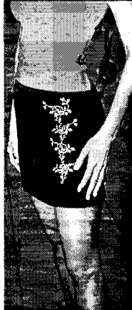
Liian tihyt minihame.