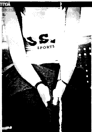
Liian kapaa ja piukkoja paitoja on kielletty.