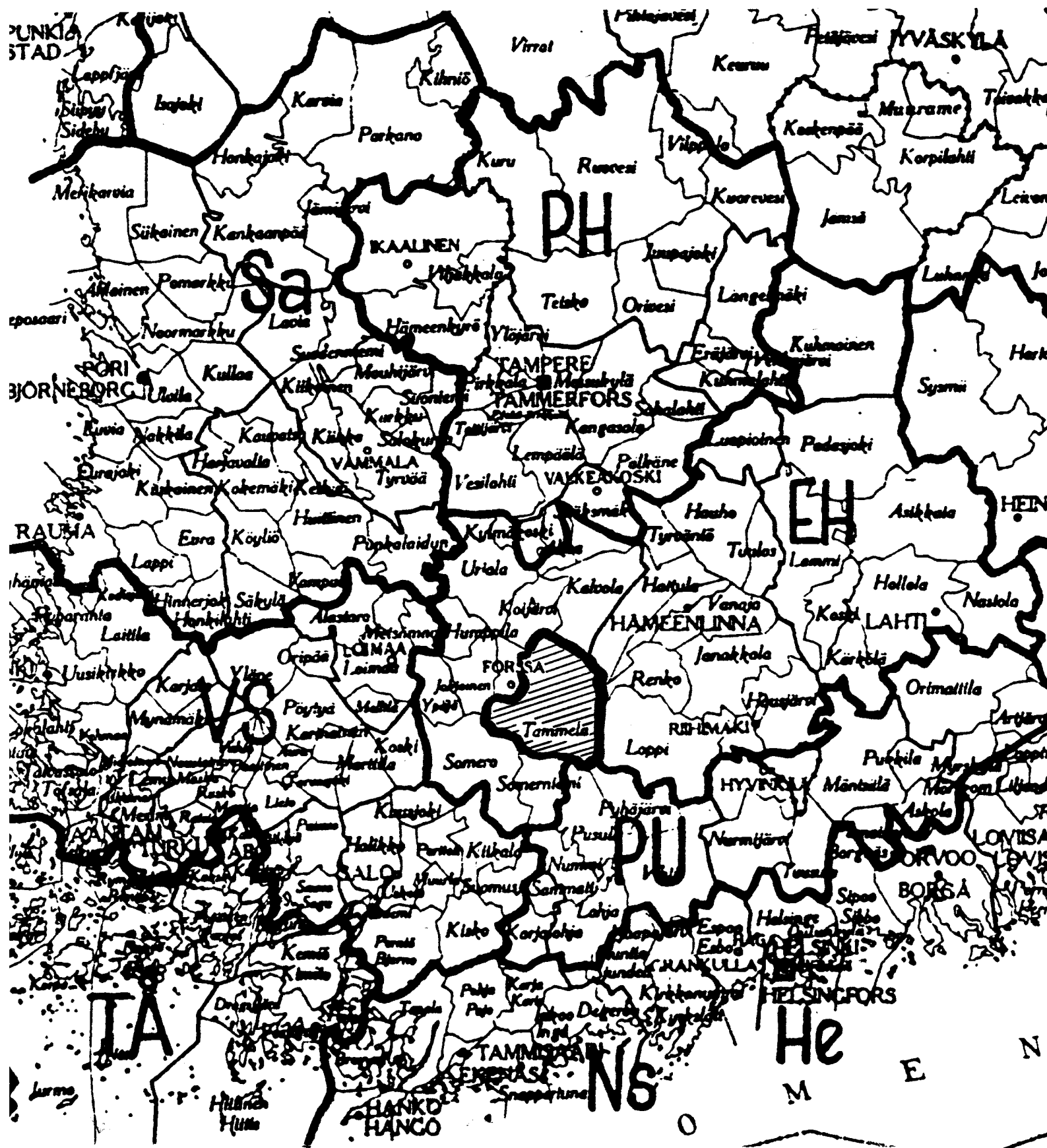
Suojeluskuntapiirit 1930-luvulla.