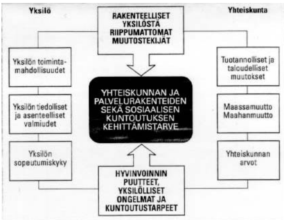
KUVA 2. SOSIAALINEN TOIMINTAKYKY YKSILOÄ JA YHTEISKUNNAN NÄKÖKULMISTA (JÄRVELÄ & LAUKKANEN 2000, 39).

Empowerment-projekteissa keskeiset kysymykset ovat osallistujien motivaatio sekä sosiaalinen toimintakyky. Syrjäytyminen ymmärtämässämme mielessä ilmenee usein juuri sosiaalisen toimintakyvyn ongelmina. Nämä ongelmat yhdessä muiden tekijöiden kanssa aiheuttavat yleensä sen, että projektien osallistujat eivät kykene omin voimin tai normaalipalveluiden avulla selviytymään avoimilla työmarkkinoilla. Työhallinnon toimet ja ammatillinen kuntoutuskaan eivät usein kykene kattamaan kuin osan tarvittavista toimenpiteistä. Kuva 2 havainnollistaa sitä, miten yksilön sosiaalisen toimintakyvyn kohentaminen on yhteydessä sekä yksilöllisiin että yhteiskunnallisiin tekijöihin. Empowerment-projektien on toiminnassaan pyrittävä etsimään ratkaisuja molemmilla tasoilla. (Emt., 38-39.)